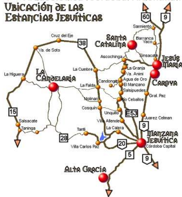
Fig. 12. Plano de la región con las estancias jesuíticas declaradas como Patrimonio de la Humanidad