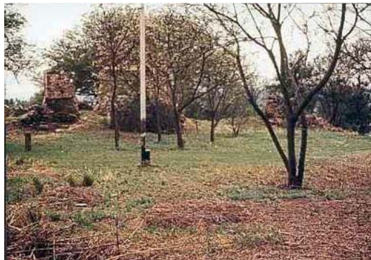
Fig. 6 Vista general en la década de 1960 de uno de los edificios mayores.