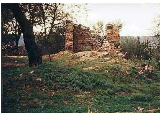
Fig. 3 Uno de los edificios en 1962 con derrumbe reciente del muro posterior.