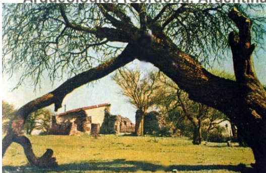
Fig. 2 Vista del conjunto en 1961 en que se observa que aun estaba en pie buena parte del conjunto.

La Formación de una Ruina Histórica : O como la Estancia Jesuítica de San Ignacio paso a ser Arqueológica (Cordoba, Argentina).