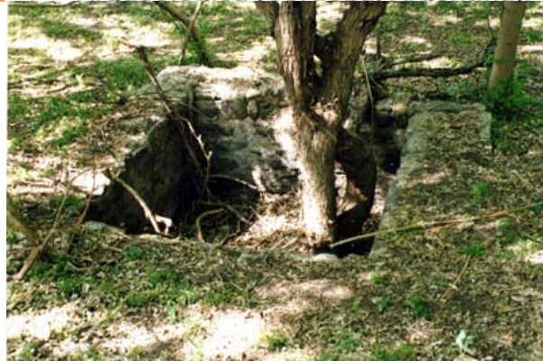
Fig. 8 Construcción cuadrada, posible jaguel conservado completo (2003)

La Formación de una Ruina Histórica : O como la Estancia Jesuítica de San Ignacio paso a ser Arqueológica (Cordoba, Argentina).