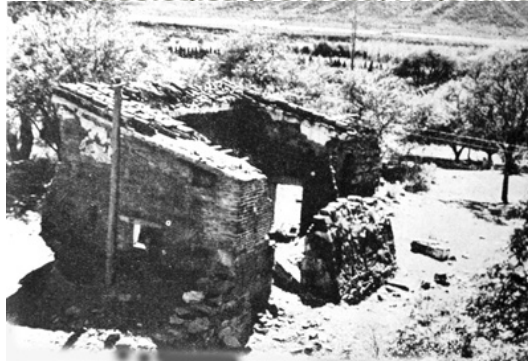
Fig 5 Una de las construcciones del caso de la estancia en pleno proceso de deterioro pero con paredes aun en pie en la década de 1950.

La Formación de una Ruina Histórica : O como la Estancia Jesuítica de San Ignacio paso a ser Arqueológica (Cordoba, Argentina).