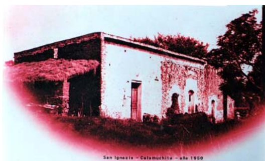
Fig. 4 Sector completo aunque sin galería de la construcción principal de la estancia en la década de 1950.