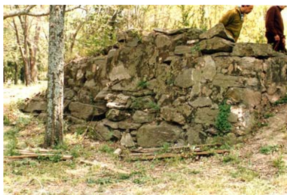
Fig. 7 Restos de los muros de piedra de la iglesia (2003).