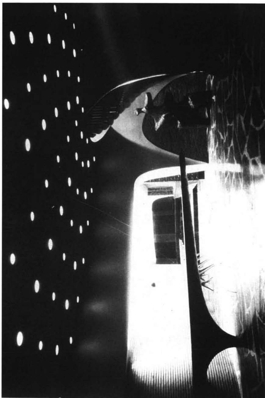
Foto 3: Cámara de Comercio de Córdoba. R. de La-Hoz y J. M a . García de Paredes.