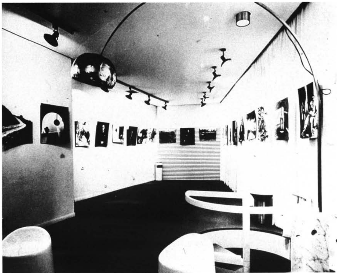
Foto 6: Galería de Arte "Studio 52" (planta superior de "Studio Jiménez").