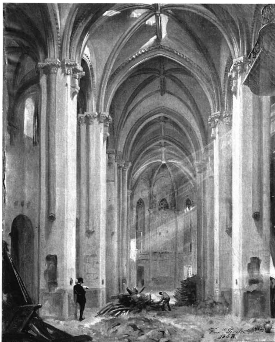
IGLESIA DE SAN MIGUEL DE SEVILLA EN EL ACTO DE COMENZAR SU DERRIBO ORDENADO POR LA JUNTA PROVISIONAL EN EL MES DE OCTUBRE DE 1868

Lámina nº 1: Interior de la parroquia de San Miguel tras su clausura. Lienzo de Francisco Peralta. Sevilla, 1868. Colección particular, Sevilla. (Gentileza del profesor Valdivieso.)