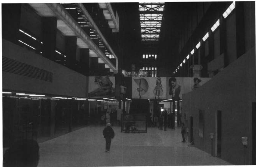
Hall de entrada. Tate Modern, Londres.