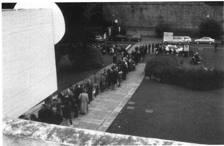
Entrada Fundación Joan Miró. Barcelona