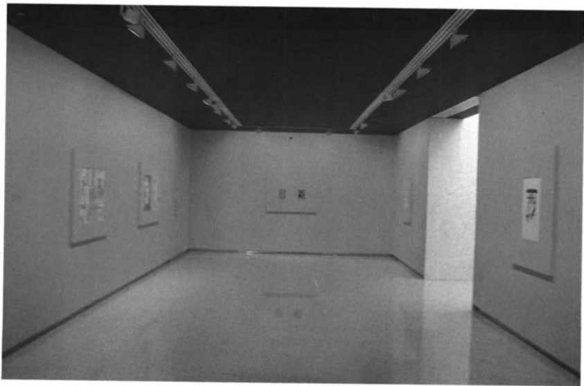
Obra en papel en la Colección El Monte. Centro Cultural Fundación El Monte, Sevilla.