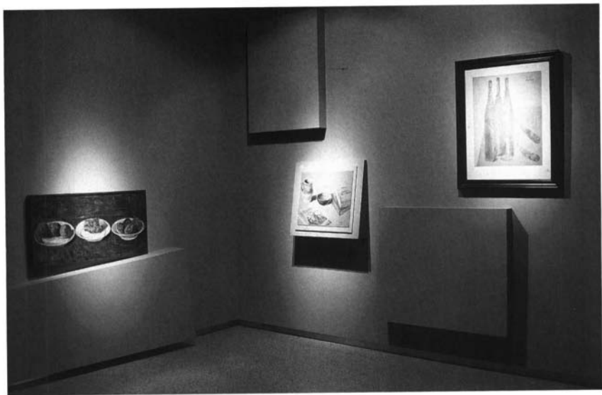
Lenguajes . 2000. Centro Cultural Fundación El Monte. Sevilla.