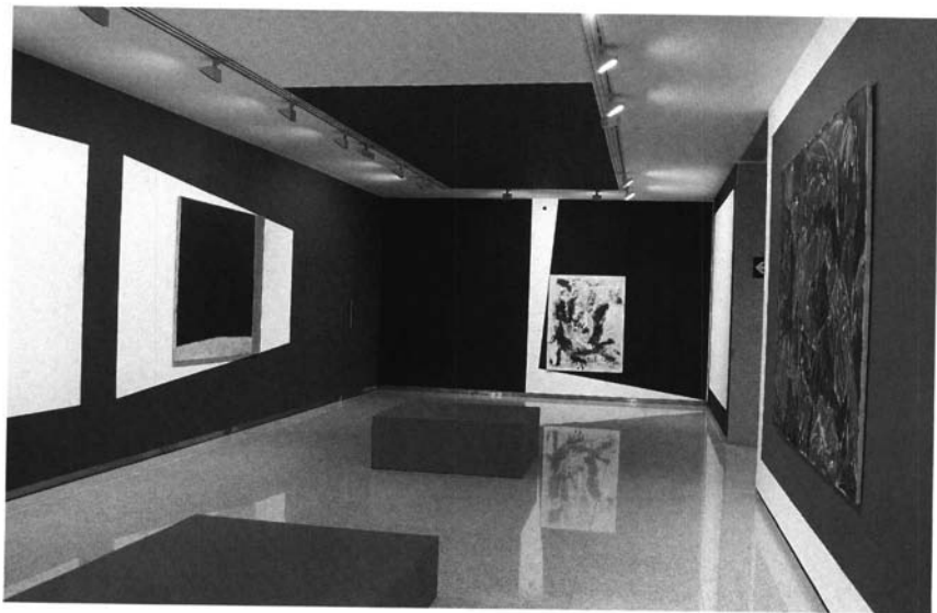
Lenguajes. 2000. Centro Cultural Fundación El Monte. Sevilla.