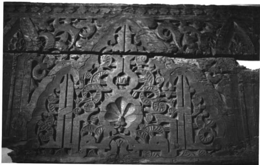
Fotografía 8. Inscripción cúfica "La Felicidad", escrita en espejo, de un arrocabe sevillano. (I.G. N° 6.176).