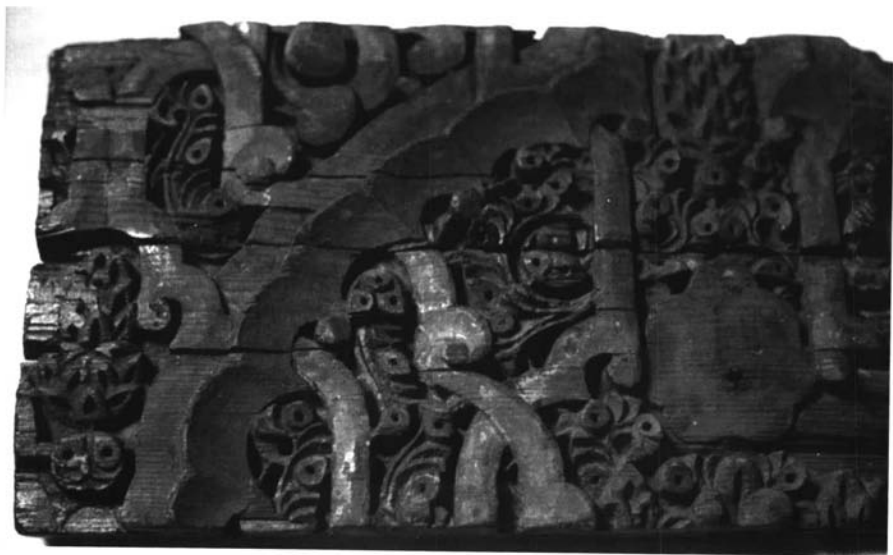
Fotografía 2. Fragmento del arrocabe de una cubierta de la casa nº 4 de la calle Cristo del Buen Viaje de Sevilla. (I.G. N.º 3.925).