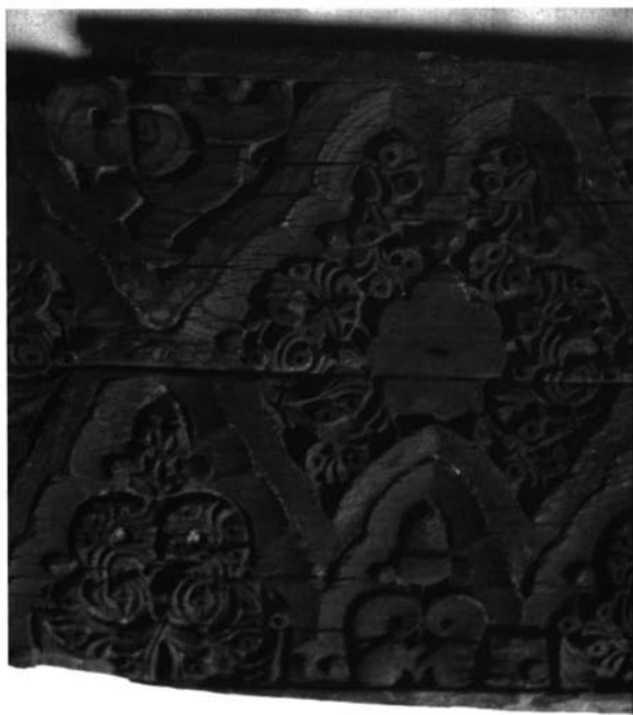
Fotografía 3. Detalle de la decoración del arrocabe de la calle Cristo del Buen Viaje de Sevilla. (I.G. N.º 3.926).