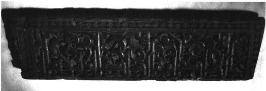
Fotografía 4. Inscripción cúfica "Bendición Perpetua" del arcoabe de la Madrasa al-Yadida de Ceuta. (I.G. N.º 3.969).