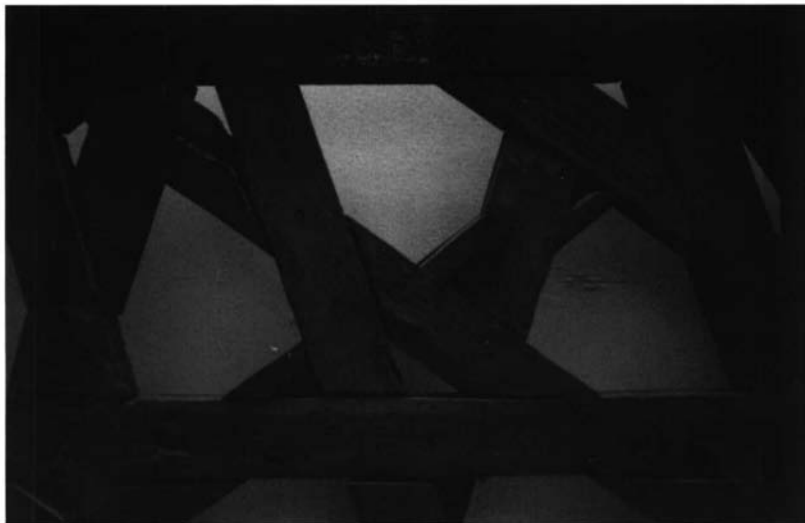
Fotografía 5. Fragmento de la estructura de un almizate decorado con lazos de 8 occidental apeinado del palacio de los Condes de Gelves. (I.G. Nº 435).