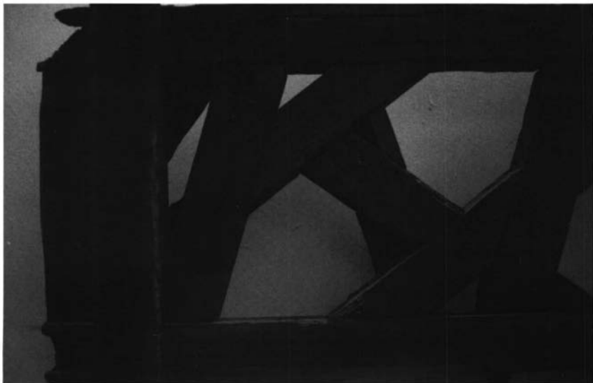
Fotografía 6. Reverso del almizate anterior en que se aprecian los elementos de la composición del mismo. (I.G. Nº 435).