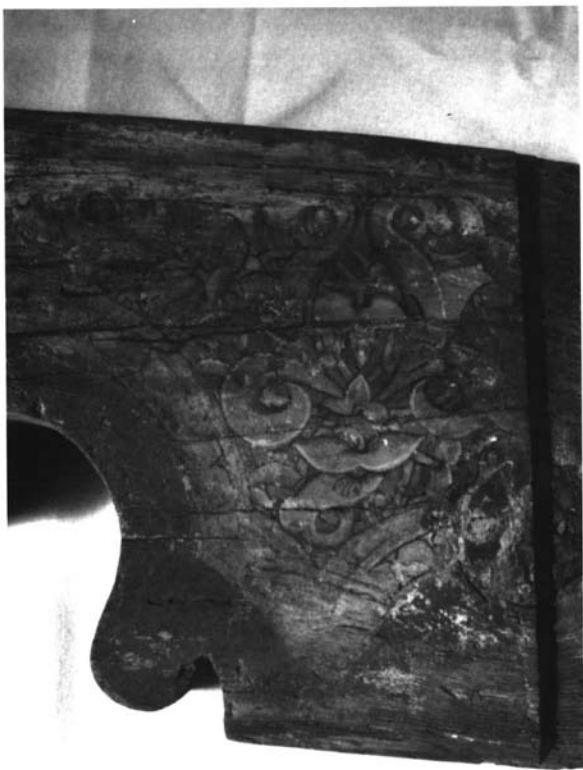
Fotografía 7. Canecillo procedente de un antiguo alfarje de la iglesia sevillana de San Marcos. (I.G. N° 475).