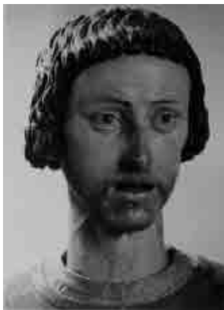
Fig. 4. San Diego Kisai. Museo de Bellas Artes. Sevilla.