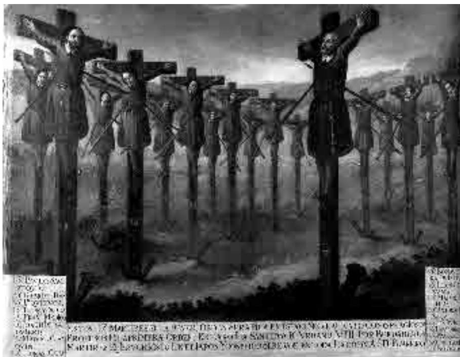
Fig. 1. Mártires de Japón. Medios del S. XVII. Convento de Santa María de Jesús, Sevilla.

La fiesta continuó el domingo 5 de marzo con las honras por los santos mártires. El oficio fue grave y con gran esplendor entre el auditorio, concluyendo con una solemne procesión del cabildo de la villa con sus maceros. Los siguientes días se dedicaron a fiestas por la Concepción y el Santísimo Sacramento, con lo que se cerró una de las fiestas más renombradas del primer tercio del siglo XVII en Carmona. Independientemente de los ornatos levantados, esta Relación constituye un documento destacado que ha permitido conservar la memoria de tan señalado acontecimiento, a través del cual conocemos cómo vivía y sentía la sociedad carmonense del Antiguo Régimen, unos como actores, otros como espectadores, ante la pasión de la fiesta.