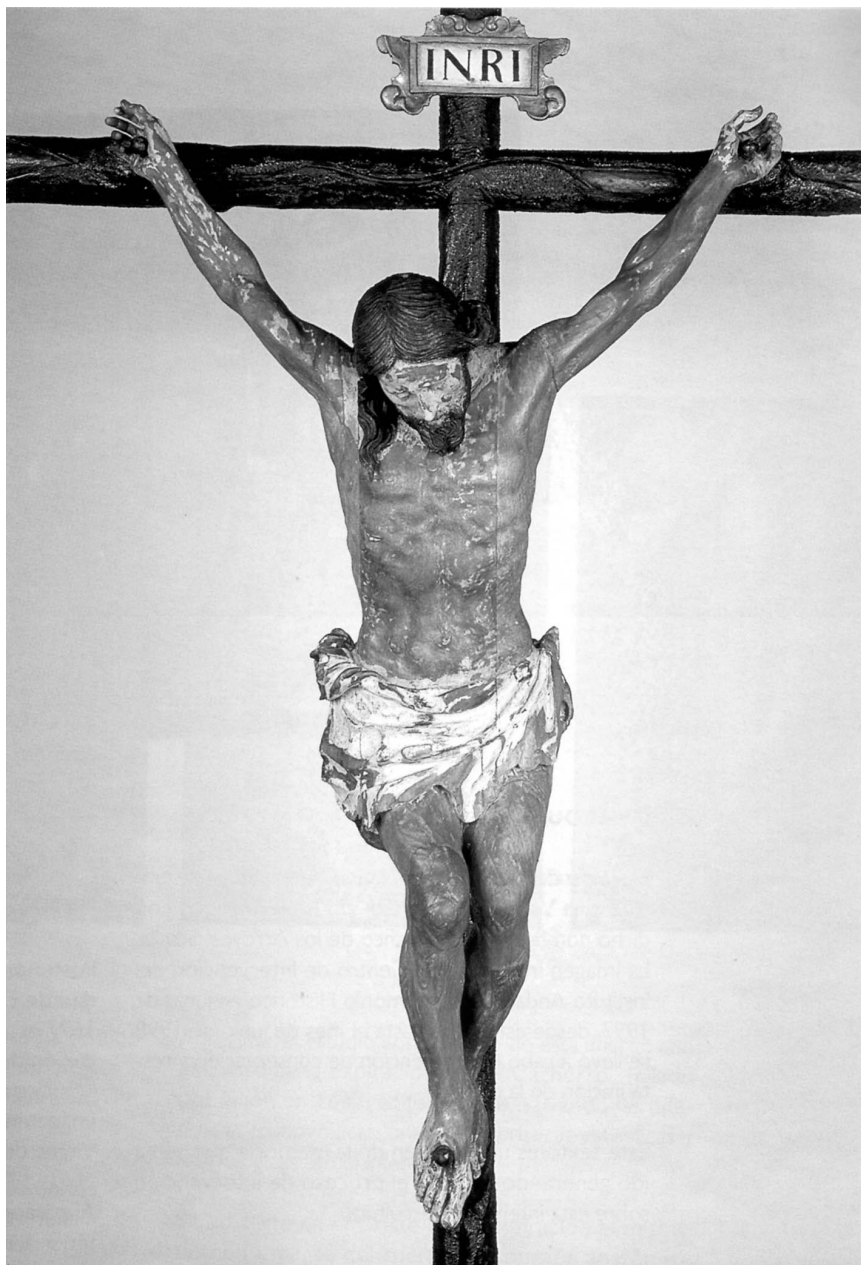
Figura 3. Francisco Antonio Gijón. Cristo de los Vaqueros. 1677. Ermita de Escardiel. Castilblanco de los Arroyos. Sevilla.