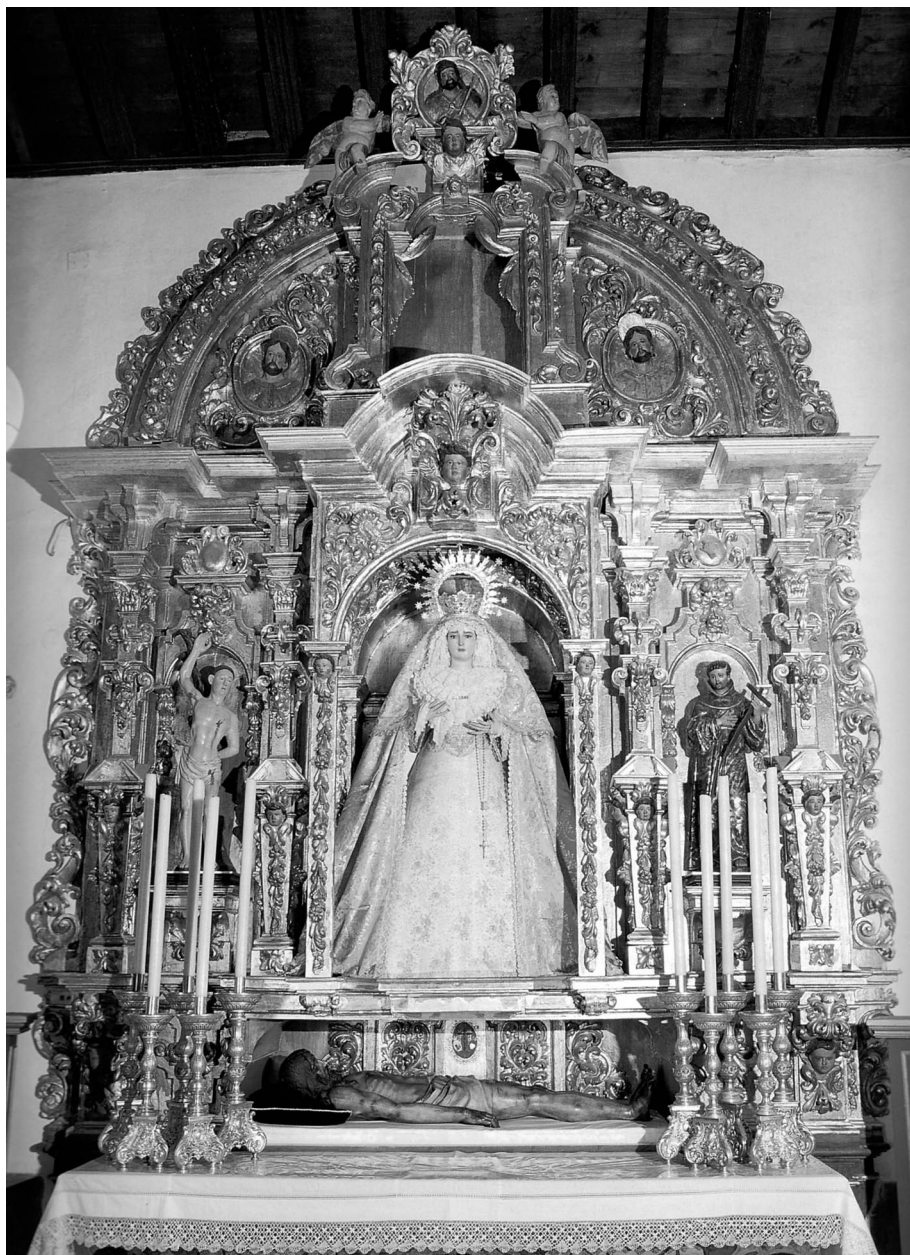
Figura 4. Retablo de la Cofradía de la Soledad. Parroquia del Divino Salvador. Castilblanco de los Arroyos. Sevilla.