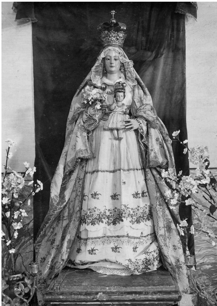
Figura 2. Nuestra Señora de Escardiel. Castilblanco de los Arroyos. Sevilla.