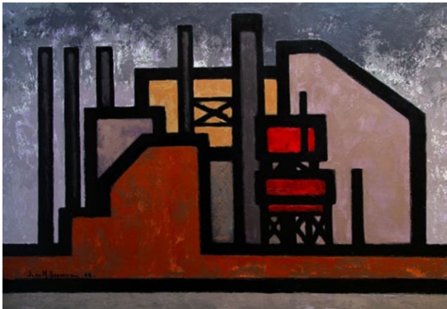
Figura 2. Fábrica. Sánchez. 1966. Óleo sobre lienzo 120 x 80 cm.