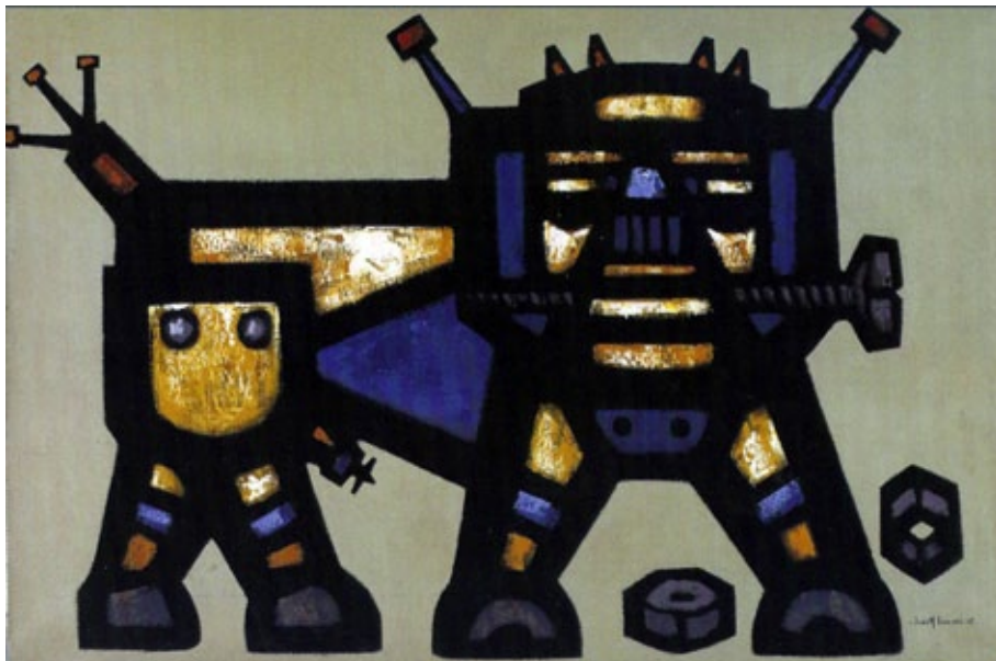
Figura 3. Perro Robot. Sánchez. 1966. Óleo sobre lienzo 120 x 80 cm. Catálogo: VYP galería de exposiciones 2007. Buenos Aires.