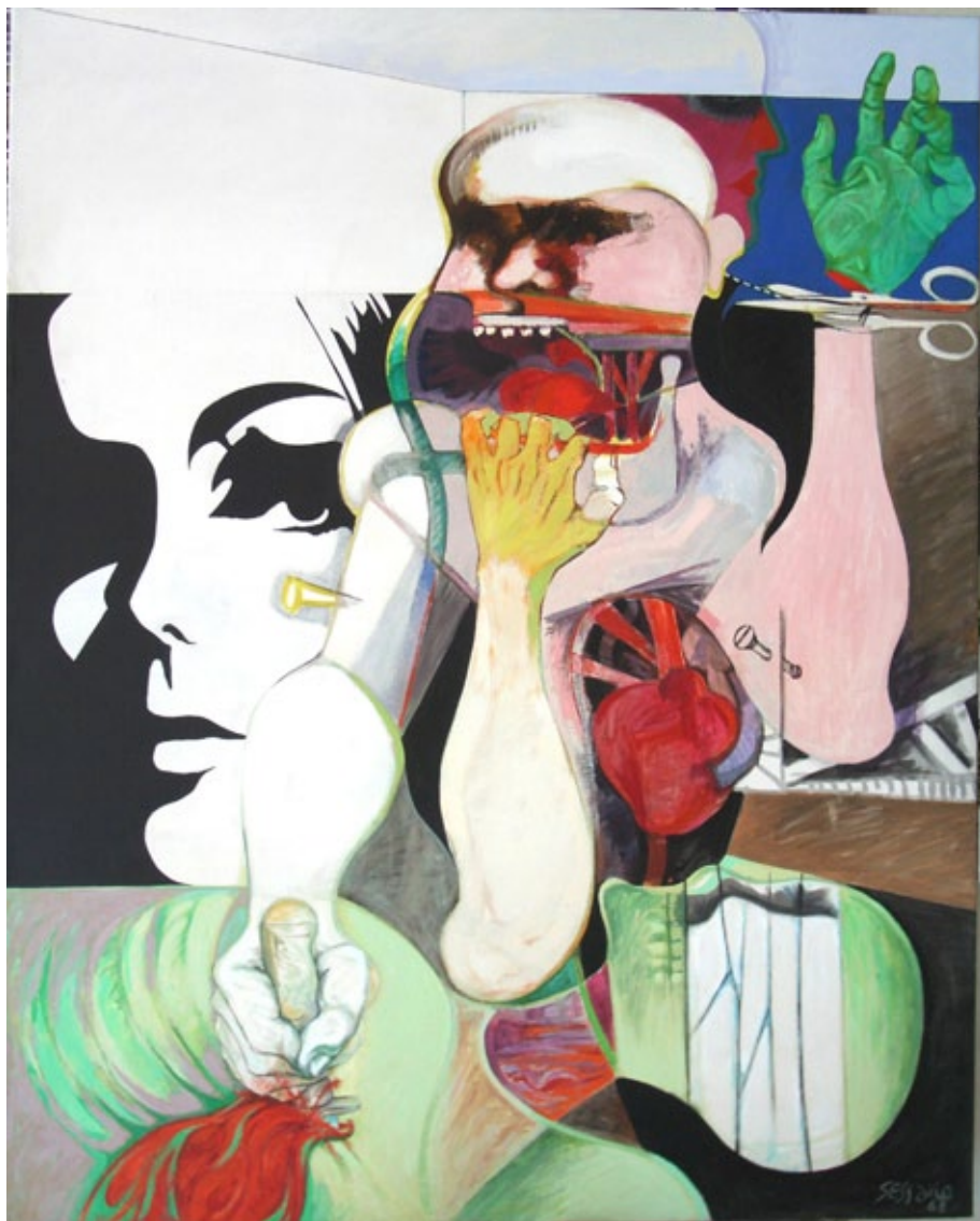
Figura 9. La lucha por la vida. Sessano. Óleo sobre acrílico 150 x 120 cm. Propiedad de Carlos Sessano.