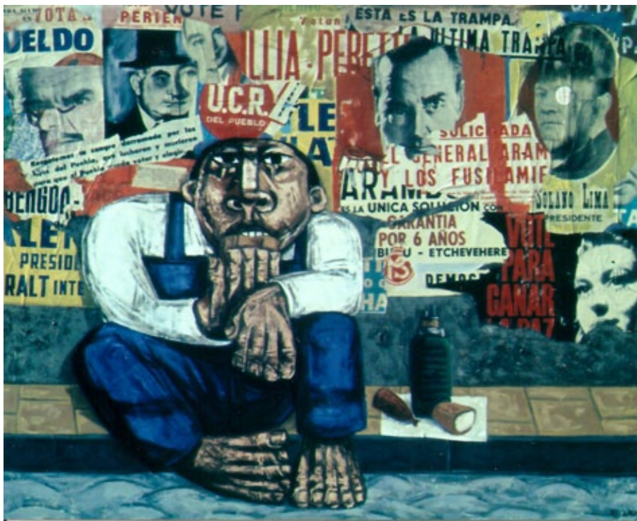
Figura 5. Los candidatos del pueblo. Sessano. 1966. técnica mixta 120 x 150 cm. Imagen cedida por el autor.