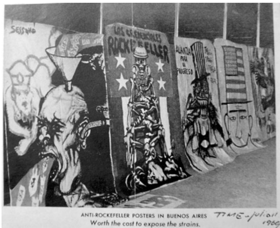
Figura 10. Recorte de prensa. Imagen referente a la muestra anti-Rockefeller Buenos Aires (Time 11 de julio de 1969). Obsérvese el primer cartel a la izquierda firmado por Sessano.