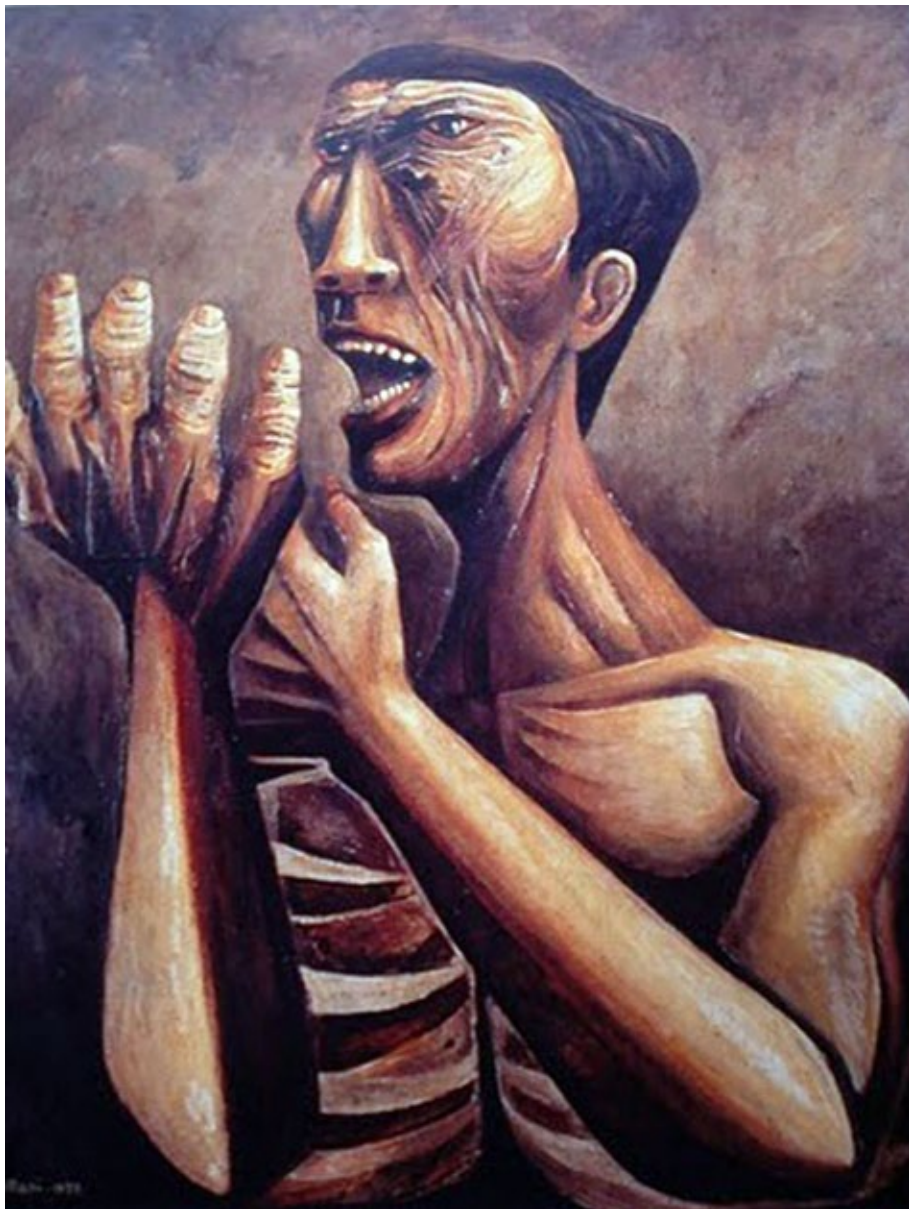
Figura 1. Campesino. Mollari. 1963. Óleo sobre tela 150 x 120 cm. Catálogo: Movimiento Espartaco. Galería Van Riel 1963. Buenos Aires.