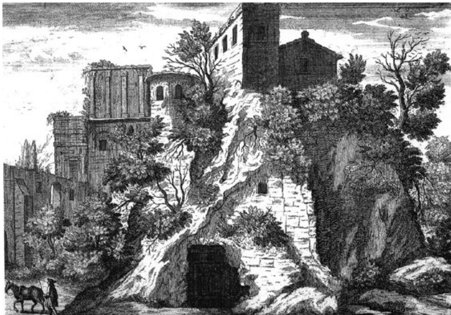
Figura 7. Grabado de las ruinas del teatro de Italica (Cerro de San Antonio) según el dibujo de Elisha Krikall. Obra en cobre, talla dulce y aguafuerte, datada en el primer cuarto del siglo XVIII. (Grabado realizado para la obra Remarks on Several Parts of Europe; Relating Chiefly to the History, Antiquities and Geography... , London, Bernard Lintot, 1726, t. II.Serrera, 1989, lám. 141).