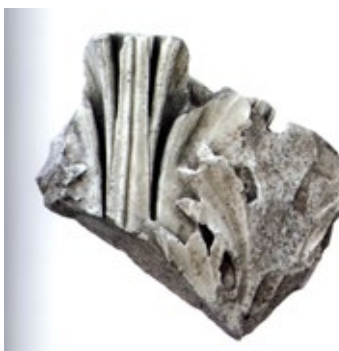
Figura 2. Fragmento de capitel colosal de orden corintio del templo de la calle Morería, Córdoba. Museo Arqueológico y Etnológico de Córdoba. (Peña-Ventura-Portillo, 2011, p. 311, Figura 17).