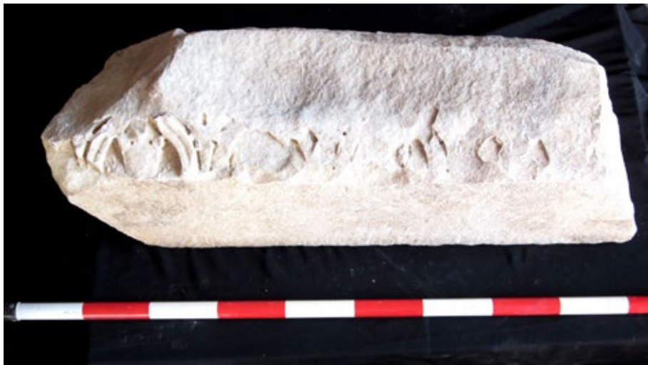
Figura 3. Coronamiento de arquitrabe de grandes proporciones. Museo Arqueológico y Etnológico de Córdoba.