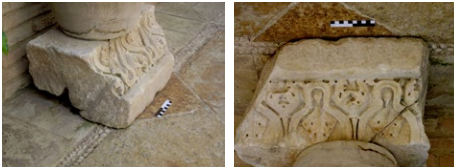
Figura 4. Fragmento de coronamiento de arquitrabe inédito, Córdoba. Colección particular.