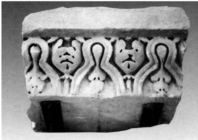
Figura 5. Fragmento de coronamiento de arquitrabe. Museo Arqueológico y Etnográfico de Córdoba. (Márquez, 1998, p.267, lám. 19, Figura27).