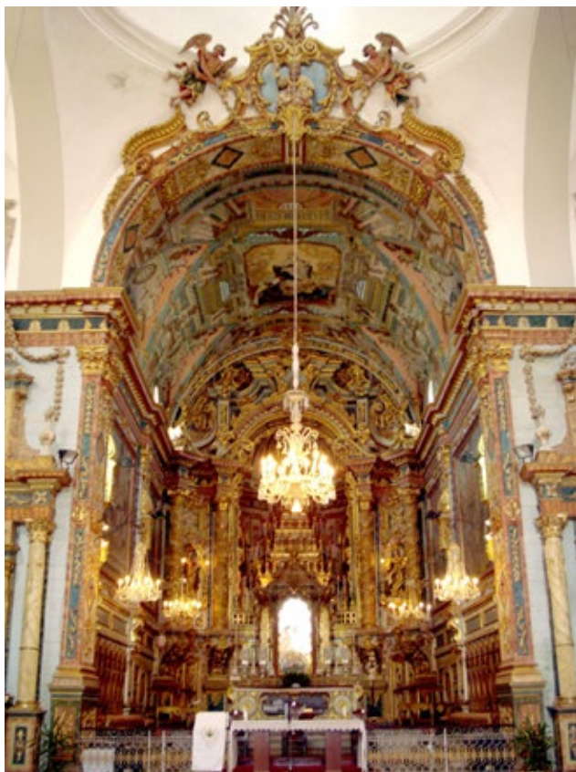
Fig. 5. Aspecto geral do arco da capela-mor da igreja da Ordem Terceira de Nossa Senhora do Carmo de Tavira.