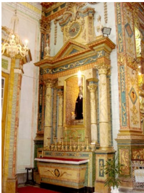
Figura 1. Retábulo colateral (Evangelho) de Nossa Senhora das Angústias, na igreja da Ordem Terceira do Carmo de Tavira.