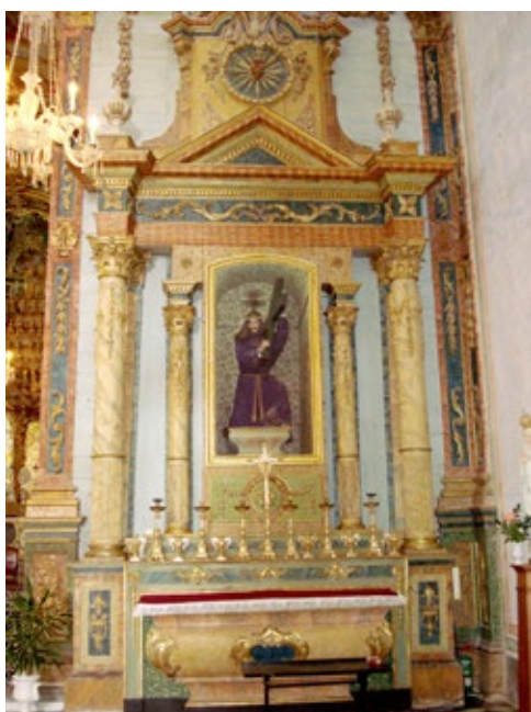
Figura 2. Retábulo colateral (Epístola) do Senhor dos Passos, na igreja da Ordem Terceira do Carmo de Tavira. (Foto do autor).