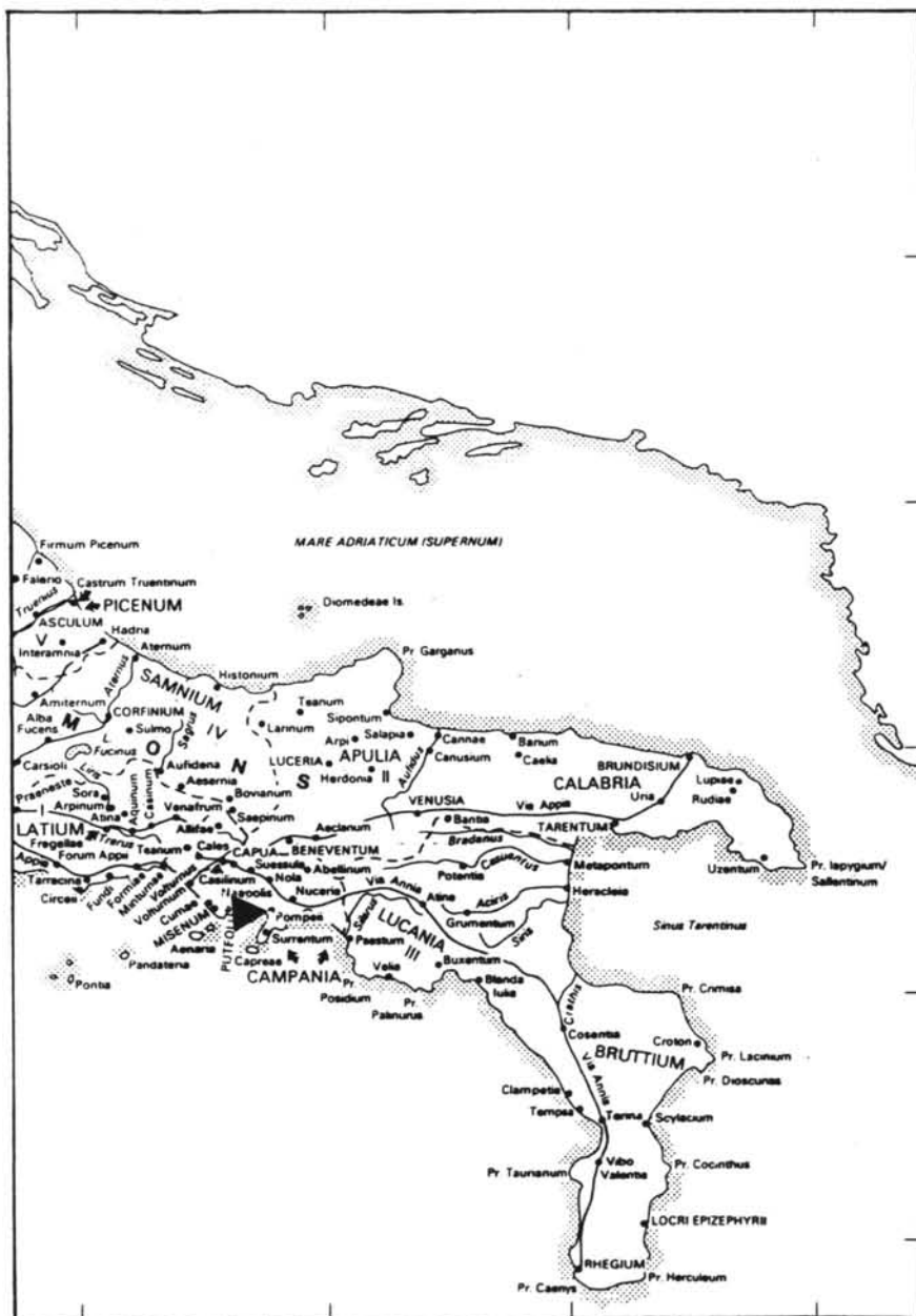
Pompeii = CLE 915; CLE 2048