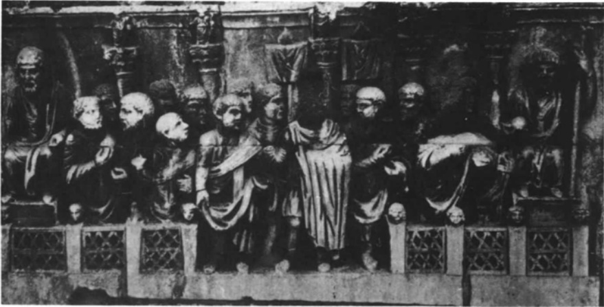
LÁM. III. III,1 (arriba): relieve de Adriano del Arco de Portogallo. III,2 (abajo): escena de contio del arco de Constantino