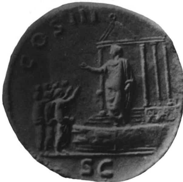
LÁM. II. III, (arriba): sestercio de Trajano. II,2 (abajo): sestercio de Adriano