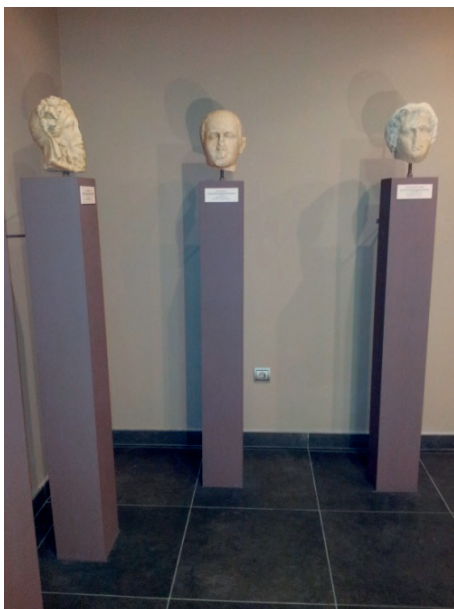
Figura 4. Esculturas romanas del MAMS.