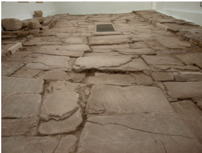
Figura 1. Tramo de cardo máximo de Asido .

de actuaciones arqueológicas, ya sea por la dinámica urbanística privada en edificios de nueva planta o por la ejecución de obras públicas que conllevan el control arqueológico en toda remoción de terreno 6 ; siendo la nota característica el impulso dado por las administraciones, en especial por la local, por actuar en espacios emblemáticos que han concluido con la puesta en valor y rentabilización social de lugares que pueden ser visitados por el público 7 , como el Conjunto Arqueológico Romano de la c/ Ortega nº 10-12, que se formó a partir del conocimiento de dos galerías de cloacas transitables descubiertas a finales de los años sesenta y la posterior adquisición por parte del Ayuntamiento de las dos fincas colindantes que, tras varias campañas de excavación, dejaron al descubierto un tramo de cardo , restos de viviendas y criptopórticos romanos, además de vestigios de un complejo alfarero almohade 8 . También se ha puesto en valor un tramo del cardo maximus 9 , varios lienzos y puertas del perímetro amurallado de la villa