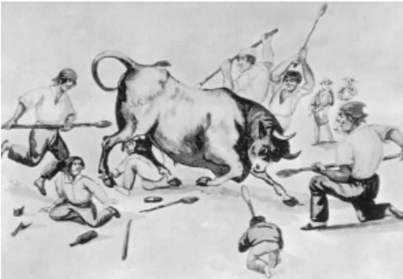
Fig. n.º 14.– Pancho Fierro: Suerte de la Moharra , 26 x 20,5 cm, acuarela, Lima, Museo Taurino de Arte (Berckemeyer, 1966: 49).

Don Rodrigo de Mendoza entró sólo en la plaza, de aventurero, en su caballo, con dos pajes y dos rejones y los empleó bien, y salió muy airoso, sin mudar caballo y con muchos vítores» (Mugaburu, 1935: 177).