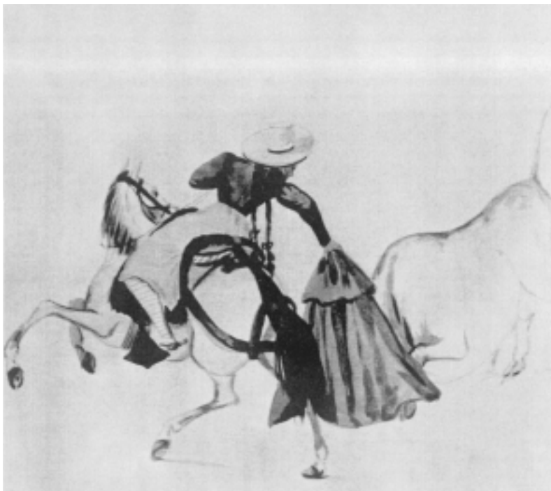
Fig. n.º 17.- Anónimo (87): Mujer toreando a caballo , acuarela, Lima, Museo Taurino de Arte (Berckemeyer, 1966: 50).

conductores de las desjarretaderas, y dos que llevaban el puesto de garrochas: unos y otros con monteras de terciopelo con láminas de plata, en las que estaban grabadas las armas del Rey y las de la ciudad» (Mendiburu, 1902: 83-84).