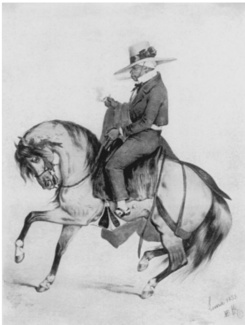
Fig. n.º 16.– Bonnaffé: Torero a caballo: el Capeador , litografía, Lima, Museo Taurino de Arte (Berckemeyer, 1966: 47).