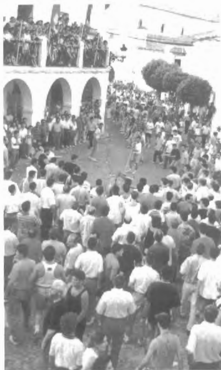
Fig. n.º XII.12.— El Toro de la Virgen por delante del Ayuntamiento. Aunque el Prof. Pitt-Rivers pronosticara el aumento de la participación activa de las mujeres en la carrera del Toro de cuerda esta instantánea no parece confirmarlo: mientras que todos los que sostienen la soga son varones, la terraza alta del Ayuntamiento aparece completamente ocupada por mujeres, es decir, a salvo de cualquier sobresalto con el toro.

para llegar a la calle Corrales y coger la de Las Piedras. La procesión desemboca así en la Plaza, la rodea y vuelve a subir por la calle San José, toma Mateos Gago, sube el Portal y