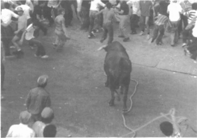
Fig. n.º XII.10.- Al "Toro de la Virgen" se le exige un gran trapío y pertenecer a una ganadería de prestigio. En la imagen un imponente toro "colorao" del hierro de Núñez corrido en Grazalema (Fragmento de una postal de P. González).

la Virgen del Carmen vistiéndola con un traje espléndido y arreglando el paso o trono sobre el que hará su triunfal recorrido procesional por la ciudad (Fig n.º XII.9). Durante la ceremonia de vestir a la Virgen, las mujeres se le acercan para orar y, a continuación, todos los fieles, a lo largo de nueve días, le