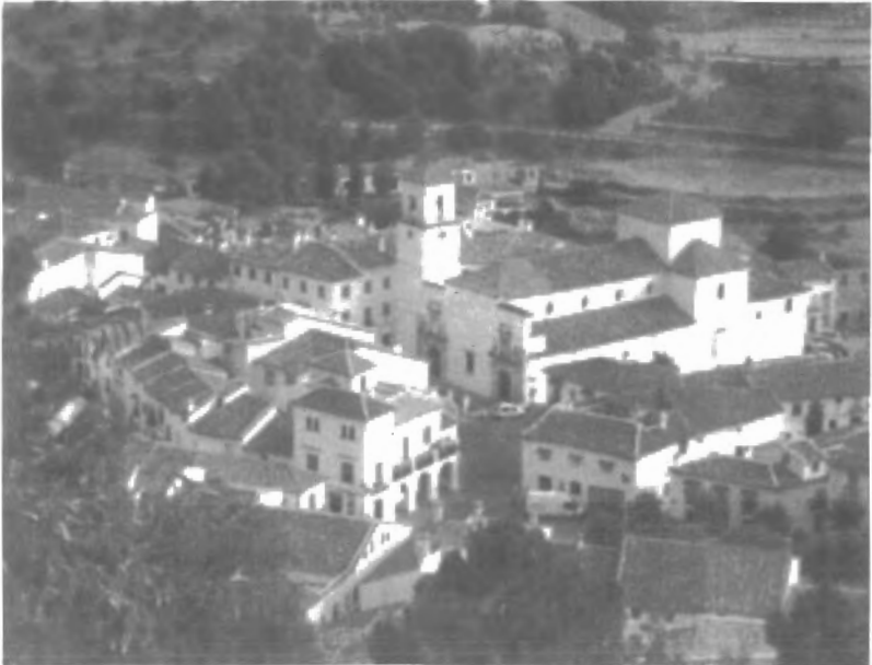
Fig. n.º XII.2.— Vista panorámica de Grazalema. Grazalema es un pueblecito de la sierra de Ronda de algo más de dos mil habitantes entre los que hay que contar los que viven en Benamahoma, una aldea situada a 6 kms. de distancia. Al término de Grazalema le pertenece, también, un valle fértil y pintoresco, la Ribera de Gaidovar. El caserío está construido con una bella arquitectura de los siglos XVII y XVIII, época en la que Grazalema vivió una gran prosperidad ligada a la industria de la lana de sus rebaños de ovejas.

popular española que, en ciertos aspectos, llegará hasta lograr la penetración, de dichos juegos, en las celebraciones religiosas oficiales. Puesto que el toro, el protagonista del culto cen-