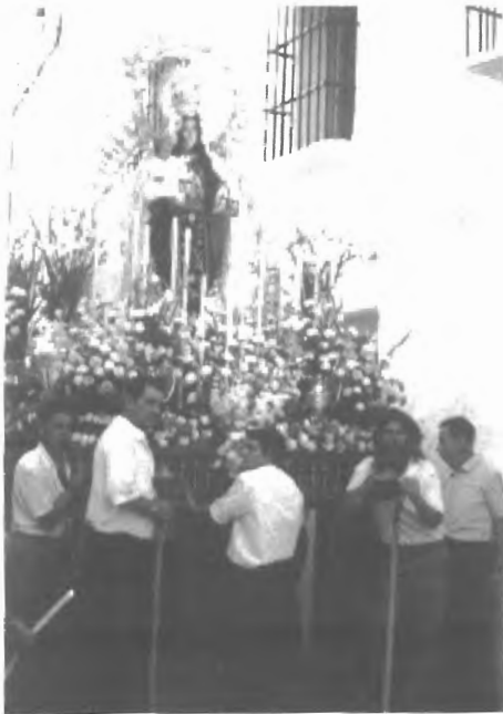
Fig. n.º XII.9.— Procesión de la Virgen del Carmen La Virgen del Carmen, precediendo al Toro de cuerda , sale en procesión de la Iglesia de San José, templo construido en el siglo XVIII por la orden religiosa de los Carmelitas descalzos.

Aunque el Toro ensogado está bajo la advocación de la Virgen del Carmen, ésta no es la patrona del pueblo pues Gra-