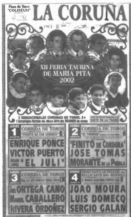
Fig. n.º XII.6.- Cartel de la Feria de La Coruña, de la temporada del 2002 (Apud publicidad inserta en 6TOROS6, 2002, n.º421, contracubierta). Obsérvese, por el texto del cartel, cómo participan en la feria de La Coruña los más importantes toreros dispuestos a matar corridas de las ganaderías más cotizadas del momento. Se da, además, la extraordinaria circunstancia de que la plaza de La Coruña fue la primera en cubrir su ruedo.

todas partes rige el Reglamento taurino que publica el Ministerio de Gobernación aunque, en los últimos tiempos, se hacen intentos, por parte de ciertos sectores del planeta de los toros, de que los asuntos taurinos pasen a estar bajo