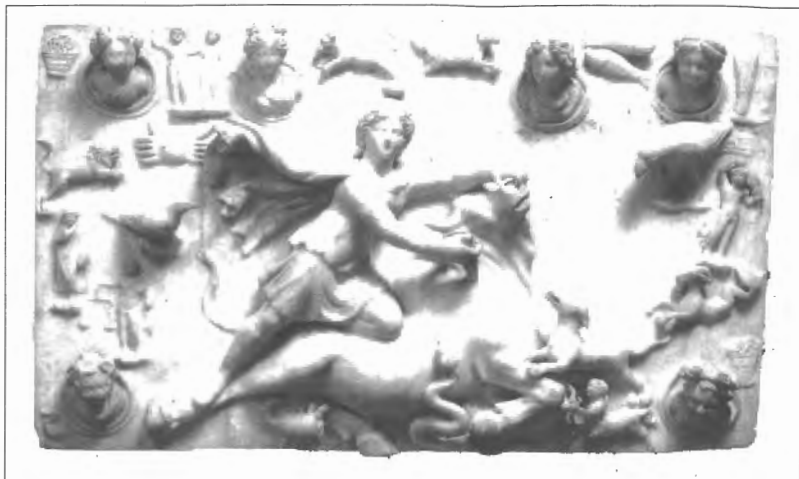
Fig. n.º XII.3.– Relieve mitraico , procede del Mitreo de Sidón (Líbano) y debió ser producido entre los siglos II y IV d. C., 77 x 44,5 cms. París, Museo del Louvre. El sacrificio del toro es el rito principal del mitraísmo como el del Cordero lo es del Cristianismo (Azara, P., Com., (2002): Toros, imagen y culto en el Mediterráneo antiguo , Barcelona, Museo de Historia de la Ciudad, Lám. 210).

(Fig. n.º XII.3 y ver supra Fig. n.º X.2). El calendario de la tauromaquia corresponde, grosso modo , al de las fiestas religiosas. Por otra parte, además de la corrida convencional, cada municipio organiza la conmemoración de su santo patrón, después de la misa que se le dedica, con una fiesta