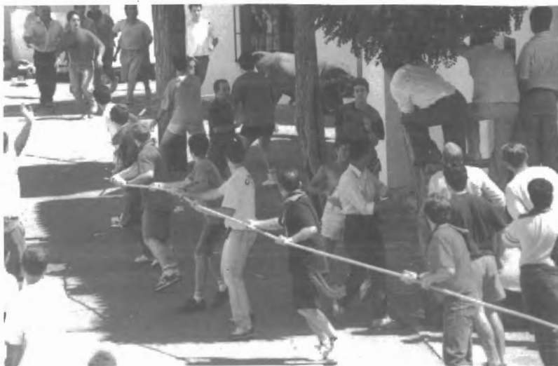
Fig. n.º XII.11.— La importancia de la soga . En la fiesta taurina de Grazales la soga es fundamental para dirigir al Toro por el itinerario que marca la tradición (Fotografía anónima. París, Archivo Pitt-Rivers).

fue descrita por un antiguo mayordomo de la Hermandad de la Virgen del Carmen. Ahora bien, aprovechamos, también, la ocasión para informar que, en Grazales, existen tres hermandades que, con motivo de las festividades de sus respectivos patronos, salen en procesión aunque siguiendo itinerarios distintos: el de la Virgen del Carmen, procesión a la que