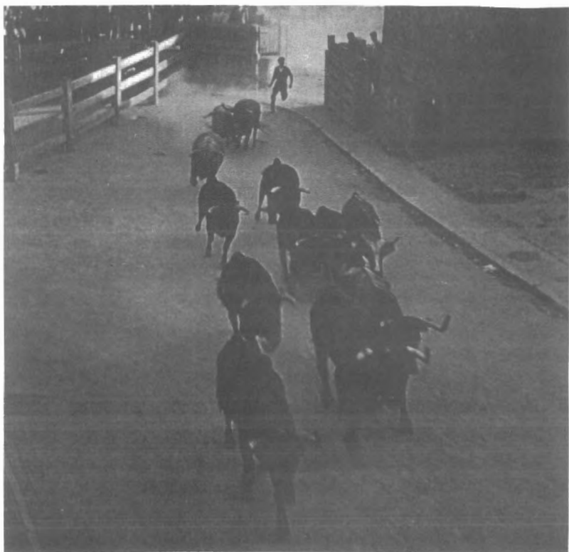
Fig. n.º XII.4.— El encierro constituye la esencia misma de la fiesta de toros. En su modalidad más sencilla consiste en conducir a los toros desde el campo hasta la plaza donde habrán de ser lidiados. Ese traslado debe hacerse a la carrera para que los toros no se desmanden por la ciudad y añadan más peligro al juego. De ahí proviene, precisamente, la voz corrida para denominar a la fiesta de toros. En los encierros más famosos se utilizan toros bravos, adquiridos en prestigiosas ganaderías de reses de lidia que después habrán de ser —como recuerda el Dr. Pitt-Rivers— estoqueados en funciones convencionales por famosos matadores. A lo largo del recorrido que realizan los toros en el curso del encierro suelen ir acompañados: por bueyes domados —cabestros— que mantienen la tropa de toros reunida (Fot. de R. Masats en R. García Serrano: Los Sanfermines , Madrid, Espasa-Calpe, 1963, lámina 38). Sin embargo, cuando el terreno es tan agreste que impide el movimiento de los caballos, son vaqueros a peón, ayudados por perros , quienes se encargan de conducirlos.