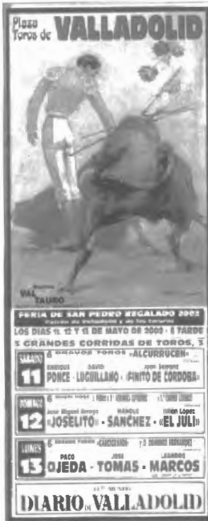
Fig. n.º XII.7.— Cartel anunciador de la Feria de Toros de Valladolid puesta bajo la advocación de San Pedro Regalado, patrono de la ciudad y de los toreros (Apud. publicidad inserta en 6TOROS6 , 2002, n.º 410, contracubierta). En este cartel, uno de los muchísimos que se encuentran tanto de hoy como de antaño, queda de manifiesto cómo las corridas de toros están integradas en un conjunto festivo que es, a su vez, religioso. Ver supra Fig. n.º X.1.

protegido por una capa de arcilla 8 . El más famoso de estos toros de fuego es el toro jubilo de Medinaceli gracias al interés que demostró por él el gran filósofo español José Ortega y Gasset.