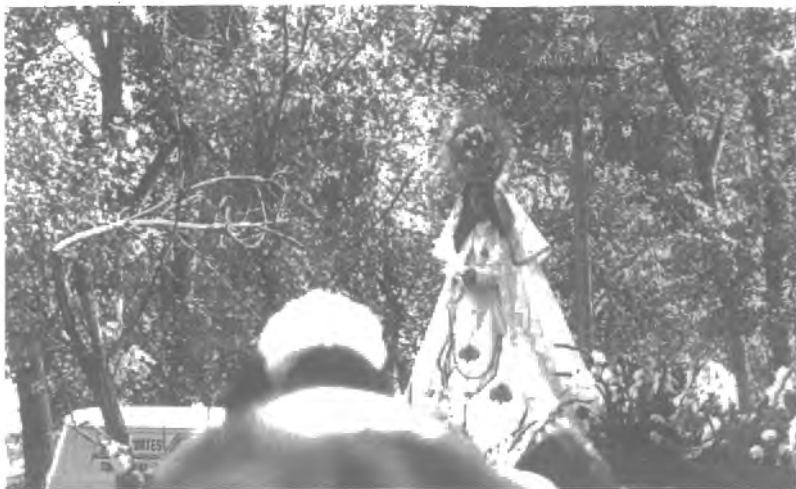
Fig. n.º VII.4.— La Virgen de la Peña (Tordesillas). La venerada imagen procesiona por los alrededores rústicos de su Ermita en la romería con que culmina y concluye la gran fiesta del Toro-Vega de Tordesillas.

vos: encierros todas las mañanas y capeas por la tarde, bailes, gigantes y cabezudos, cucañas infantiles y un circo, El Gran Circo del Mundo, que tuvo la originalidad de presentar entre seis números, uno de Búfalo Bill y otro de la lucha (dentro de un tanque de agua transparente para que el público no se perdiera nada), entre un cocodrilo y una chica guapa en bikini,