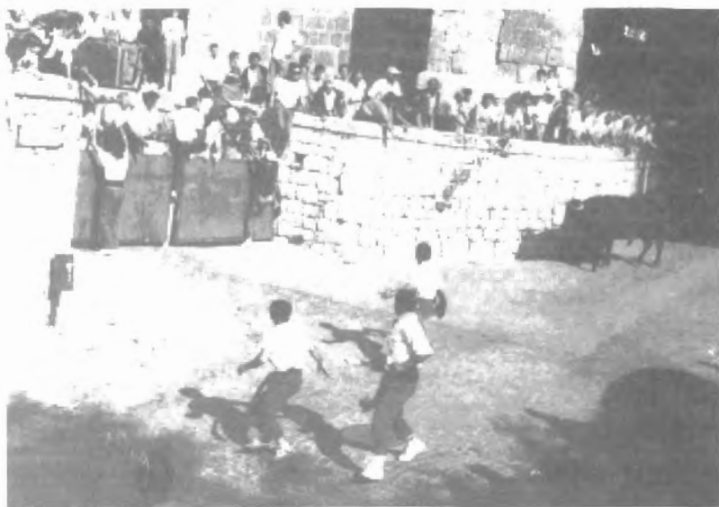
Fig. n.º VII.5.— La carrera del Toro-Vega por la ciudad antigua de Tordesillas (Valladolid). Desencajonado junto a la Plaza Mayor, el animal inicia su bajada hacia el río Duero buscando la Vega (que le da nombre al toro y a la fiesta). Ver infra Fig. n.º VIII.7

Estas son las reglas del rito según la costumbre de Tordesillas. Para interpretarlas habrá que examinar en detalle los comportamientos de los ejecutantes y de los asistentes.