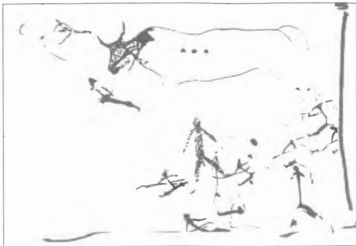
Fig. n.º VII.2.— Cazadores armados acosan a un toro . Arte parietal levantino, 4.000 a.C., Cueva Remigia (Castellón de la Plana). (Apud A. Beltrán, 1982. De Cazadores y Pastores. El Arte Rupestre del Levante Español , Madrid, Encuentro, pág. 14). Esta relación agónica con el animal constituye el paisaje natural de las poblaciones ibéricas desde el comienzo de los tiempos.

ña —¡mientras que no falta ni un nombre de banderillero, desde hace un siglo, por poco importante que fuese!— Y, sin embargo, son estas fiestas mucho más antiguas que la corrida y son capaces, junto con el testimonio de la historia (pero además