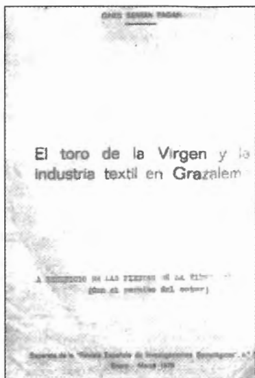
Fig. n.º 58.- Separata de un artículo de Ginés Serrán a beneficio de la organización del Toro de Grazales (Apud Serrán Pagán, 2002: 70).

plo, en algunos pueblos de la provincia de Cáceres) y el Toro llega a Grazales prudentemente ensogado, encerrado dentro de un cajón de transporte de reses y cargado sobre un camión de propulsión diesel, pero no hace mucho tiempo, los mozos lo traían acosado por las veredas de la sierra por lo menos