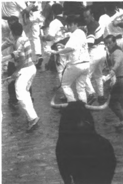
Fig. n.º 59.- Un mozo de Grazelema (vestido de vaquero a la derecha de la imagen) corre el encierro de Pamplona por la calle Estafeta (Apud Serrán Pagán, 2002: 82).

alto –proletario– y bajo –burgués–, en terminología vernácula, en jopones y jopiches . Esta tensión consustancial a la estructura de la sociedad grazalemeña se tradujo en el pasado en el enfrentamiento de mozos y en la lucha por el dominio geográfico de la corrida del Toro.