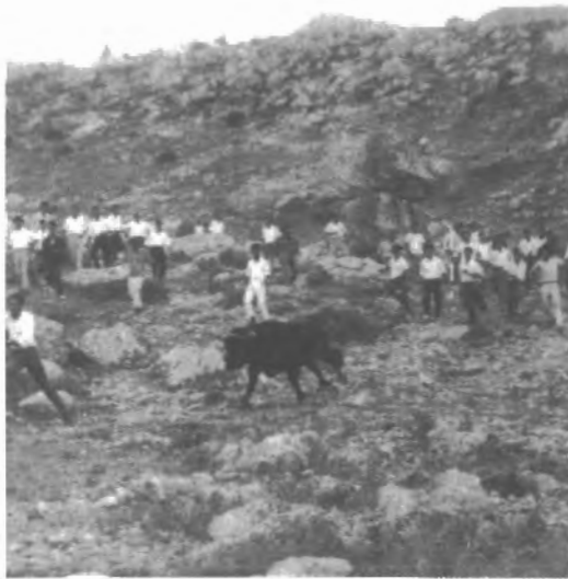
Fig. n.º 57.- Los mozos acosan por las veredas de la sierra al Toro de Grazalema (Apud Serrán Pagán, 2002: 15).

Ginés Serrán Pagán, estrechamente vinculado a la New York University quizá, por esa relación, sea uno de los pocos científicos sociales españoles que haya dedicado una parte determinante de su obra al estudio de la tauromaquia