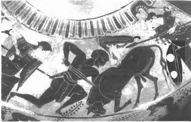
Fig. n.º 8.- Heracles y el Toro de Creta , según un vaso ático de fines del siglo VI a.C. (LIMC V).

mito está relacionado con Pasife 67 , una acepción de la Luna, hija de Apolo y mujer de Minos, quien engendró al Minotauro de su unión con un Toro salvaje enviado por Poseidón a Creta como castigo: el animal destruía con su fiereza las murallas de las ciudades, arrasaba los campos con fuego y mataba al que encontraba 68 , lo que evidencia su inspiración en el mito de Gilgamesh y el Toro Celeste mesopotámico. En la versión griega más difundida, Heracles captura al toro y lo lleva vivo a Euristeo, ofreciéndolo después en sacrificio a Hera o, según otras versiones, lo dejó