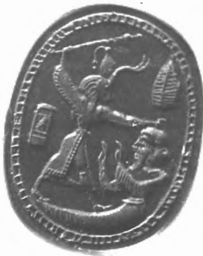
Fig. n.º 5.- Melqart-Nergal con cabeza de toro sacrificando con su maza a un monstruo marino (Culican, 1986).

do la cabeza (Fig. n.º 5). Este personaje con gorro frigio aparece con la bipennis en la mano derecha en un sello de Akko (Palestina) 37 , en dos escarabeos de Tharros (Cerdeña) y en una navaja de afeitar y en un anillo de oro de Cartago, en el que vence a un león sobre el que tiene su pierna izquierda. Culican consideró que este Héroe de la bipennis y el gorro frigio , cono-