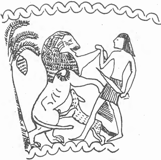
Fig. n.º 3.- Melqart cazando un león en un cuenco chipro-fenicio. Obsérvese la distinta forma de empuñar la espada (Neri, 2000, fig. 11).