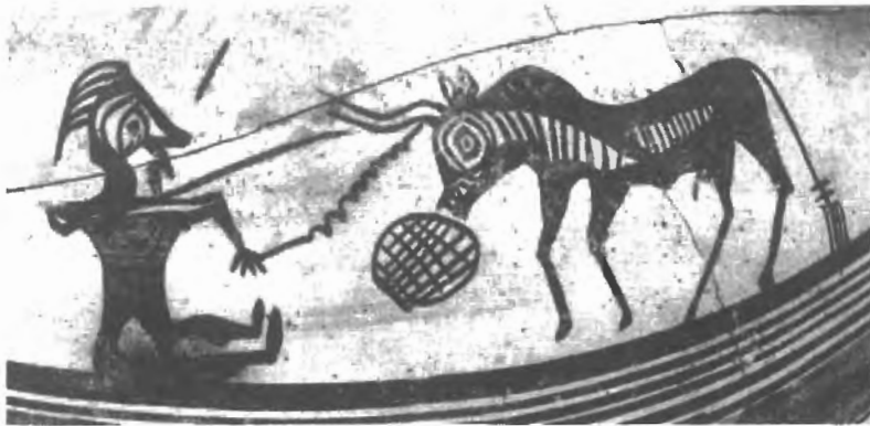
Fig. n.º 7.- Jarro chipriota con escena de tauromaquia (Karageorghis, 1965, figs. 14-15).