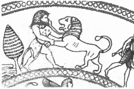
Fig. n.º 2.- Melqart con la piel del león en un cuenco chipro-fenicio (Markoe 1995, n.º Cy5).