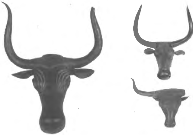
Fig. n.º 53.- Cabezas de toro. Son Corró (Costitx, Mallorca). S. IV-II a.C. Museo Arqueológico Nacional (Madrid).

Comprendiendo su gran valor histórico y documental, la Sociedad Arqueológica Luliana, con sede en Palma de Mallorca, trató de interesar en el hallazgo tanto a las autoridades locales como a los propios mallorquines. Pero, ante la indiferencia y la desidia de todos, y el peligro de la salida de las piezas hacia museos y colecciones extranjeras optó por comunicar la situación al Museo Arqueológico Nacional (Madrid). Esta institución adquirió el conjunto para su exposición en las salas madrileñas.