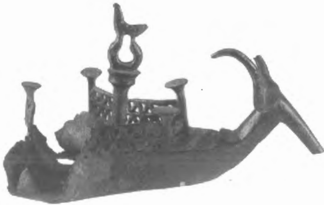
Fig. n.º 61.- Barca con prótomo bovino . Mandas (Cagliari, Cerdeña). S. X-IX a.C. Museo Arqueológico Nacional (Cagliari).

La asociación de reses y pájaros también estuvo presente entre los sardos. Figuritas variadas se encuentran diseminadas por sepulturas y recintos sagrados, aunque tal vez donde se ilustra de un modo más claro es en unas navecillas de bronce o terracota, dedicadas como objetos votivos. Estas pequeñas embarcaciones lucen en su proa prótomos taurinos, de largos cuernos y hocico estrecho y afinado (Lilliu, 1966: