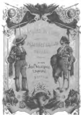
Fig. n.º 135.- Portada de Anales del toreo. (José Velázquez y Sánchez) que recientemente ha reeditado la Universidad de Sevilla, la Real Maestranza de Caballería de Sevilla y la Fundación de Estudios Taurinos, (2005).

Paetel. En otro lugar, ya expuse el interés que el público de toros despertó en muchos viajeros pues, habiendo surgido por aquella época, de los análisis de teóricos románticos de la Ciencia Política, el concepto de Nación y, más allá, el de Pueblo, hasta que no entraron en una plaza de toros no tuvieron la revelación del significado real de esta categoría política lla-