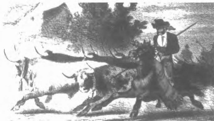
Fig. n.º 134.- Encierro de los toros , Juan Alaminos (Ed.) (1860).

por tamaño ni por estilo— en el conjunto general. La propia autora es consciente cuando afirma que estampas de series y estampas de libros «participan de los mismos elementos que las series vistas anteriormente» (177). Como elemento diferenciador aparecen los grabados de María Eugenia de Beer, ilustradora en el siglo XVII del libro sobre los Exercicios de la Gineta de don Gregorio de Tapia y Salcedo, libro todavía de toreo caballeresco que dedicó al príncipe Baltasar Carlos, el