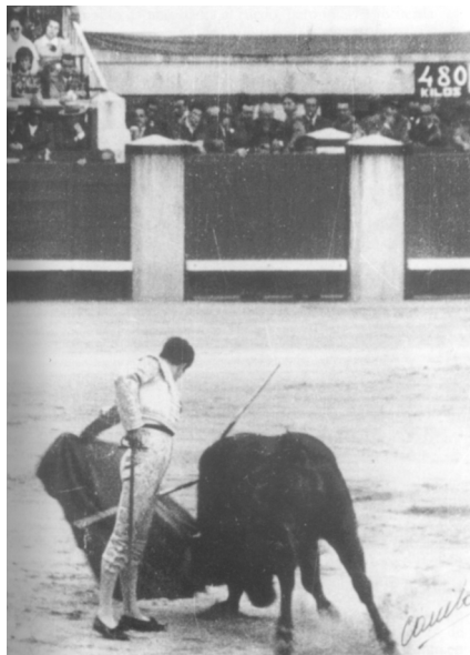
Fig. n.º 7.- Natural . Apud Andrés Amorós A. (2005): El toreo de frente . Manolo Vázquez, Madrid, Biblioteca Nueva, f.31.

Al final, la ciudad del Guadalquivir, en su reaparición en el año 1981 y muy especialmente en su magnífica despedida del 12 de octubre de 1983, abrió su templo para que en él oficiara como sumo pontífice uno de los artistas mejor dotados para este trágico ritual de vida y muerte. La delicada y certera prosa de Joaquín Caro Romero captó el impacto de su encantamiento, pues, no