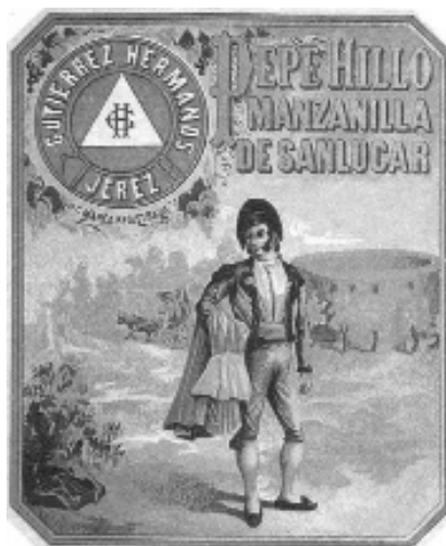
Fig. n.º 34.- Etiqueta de la manzanilla de Sanlúcar con un grabado popular.

tir de ese año se inicia una de las más virulentas competencias de la historia de la tauromaquia, rivalizando ambos diestros en suertes y guapeza . Pedro Romero Martínez, considerado como el máximo representante de la escuela rondeña , también ha quedado inmortalizado en la estética del vino a través de la más reciente etiqueta y cartelera publicitaria utilizada para promocionar tanto el brandy como la manzanilla Pedro Romero (Pedro