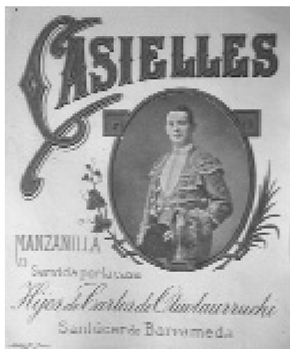
Fig. n.º 31.- Etiqueta del oloroso Perlacia , en la cual exclusivamente aparece ya el rostro de un matador.

Una ilustrativa muestra de este tipo de etiquetado de temporada está compuesta por varias marcas dedicadas a Casielles :