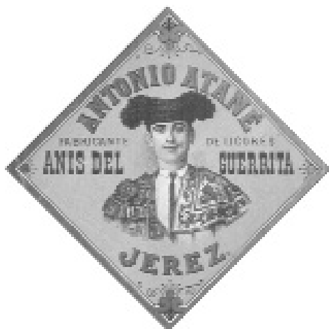
Fig. n.º 40.- Etiqueta del amontillado 'Guerrita'.

primera década del siglo. El sevillano de Tomares Ricardo Torres, Bombita , considerado entonces como el mejor torero del momento , acompañará a diversos vinos como el fino Bombita (Sánchez Romate Hnos.), en cuya ilustración aparece el torero vestido de luces, según un modelo fotográfico; fino Bombita (Jacobo Molina, 1911), donde el diestro aparece ahora ejecutando un pase de muleta de los denominados ayudados ; o xerez quina Bombita Chico (Agustín Blázquez), comercializado en