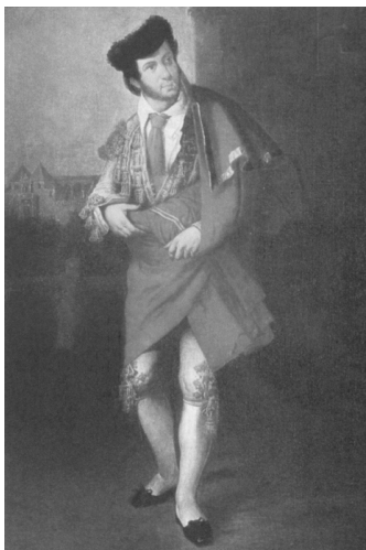
Fig. n.º 21.- Retrato de un torero de Antonio Cabral Bejarano.

tura coetánea a la edición de este etiquetado recurre abundantemente a la iconografía de la figura individualizada del matador como héroe popular, cuyo motivo será objeto de atención de los más destacados pintores de las décadas de entresiglos, a pesar de sus diferentes interpretaciones estilísticas, desde Joaquín Sorolla a Pablo Picasso, pasando por Zuloaga o Barjola, entre otros muchos. Y dentro de un ámbito más próximo a la elabo-