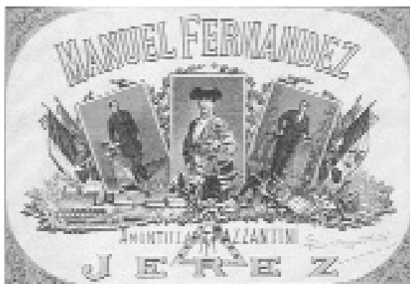
Fig. n.º 19.- Etiqueta del amontillado Mazzantini.

Además de las cromáticas series de etiquetas protagonizadas por las faenas en el campo y las suertes en la plaza, algunos retratos de toreros plasmados en la ilustración vinatera extraen directamente sus modelos compositivos de las litografías taurinas que se publicaban en las revistas ilustradas de la época y, más concretamente, en La Lidia durante su primera época (1882-1900), cuyas composiciones, firmadas mayoritariamente por