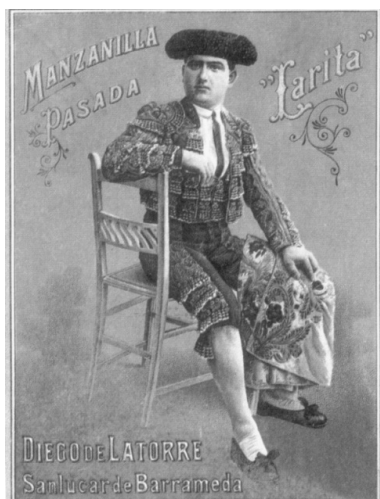
Fig. n.º. 29.- Etiqueta de la manzanilla pasada Larita.