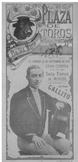
Fig. n.º 23.- Cartel taurino para la plaza del Puerto de Santa María con el retrato de Joselito.

la fotografía de estudio propia de la época, cuyas composiciones se reproducen en estas estampas del vino con todo rigor. A la hora de perpetuar la imagen del héroe taurino, aquellos fotógrafos de entresiglos parecen heredar los cánones institucionalizados por el género casticista de las antiguas colecciones de tipos y trajes del grabado popular y de la litografía romántica. Así, una gran parte de los matadores que comparecen en las estampillas vinateras, se toman directamente de los modelos ofrecidos por