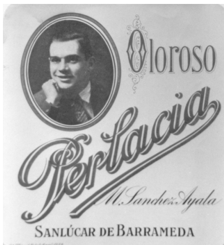
Fig. n.º 30.- Etiqueta del oloroso Perlacia , en la cual exclusivamente aparece ya el rostro de un matador.

Por último, las composiciones originales localizadas en el etiquetado de temática taurina son muy escasas, abundando más los diseños de autor en otros soportes publicitarios como la cartelería comercial o los paneles cerámicos. En general, estas pocas etiquetas originales reproducen interesantes obras firma-