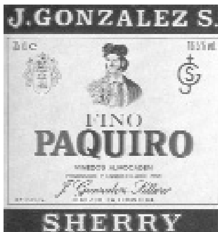
Fig. n.º 37.- Etiqueta del Fino 'Paquiro'.

Una de las más enconadas competencias de la historia del toreo tuvo como coprotagonistas, desde 1868, a la pareja de toreros compuesta por el cordobés Lagartijo y el granadino Frascuero . Una efigie de este último preside la antigua etiqueta