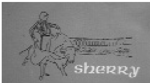
Fig. n.º 17.- Viñeta de torero realizando un lance de capa.

Por tanto, los contenidos gráficos de esta segunda etapa atienden, más que a un consumidor peninsular, a una demanda y