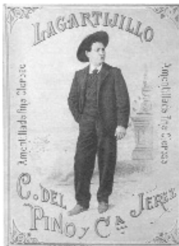
Fig. n.º 28.- Etiqueta de un amontillado fino oloroso con el retrato de "Lagartijo", con atuendo de paisano.

Ya en las décadas de los años veinte y treinta del siglo XX se produce una gran proliferación de estudios fotográficos, que