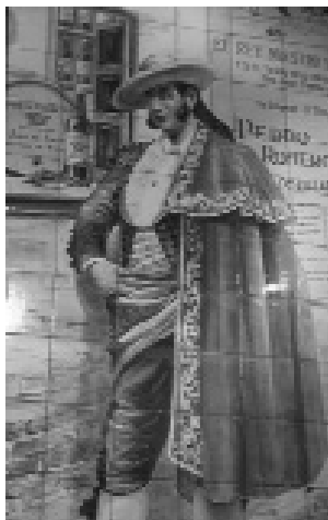
Fig. n.º 36.- Paño de azulejos con retrato de Pedro Romero en el establecimiento los Gabrieles.

Los míticos padres del toreo de la primera mitad del siglo XIX también se encuentran presentes en la estética vinatera a través de etiquetas como la de amontillado fino Cúchares (Juan L. de Meneses) o fino Paquiro (Vinícola Chiclanera, S.A.), cuyas composiciones son eminentemente textuales. Asimismo, el busto de