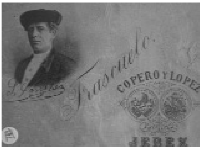
Fig. n.º 38.- Etiqueta del caldo 'Frascuelo'.