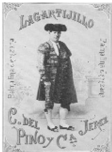
Fig. n.º 27.- Etiqueta de una palma fina jerezana con el retrato de “Lagartijo”, con atuendo de luces.

etapa novilleril. Así, por ejemplo, el diestro sevillano Francisco Posada Carnerero protagoniza algunas etiquetas como fino Posadas (Sin firma) y fino Posadas (José Pemartín). En este mismo grupo se integran otros retratos del granadino Lagartijillo , cuya imagen se utiliza para presentar tanto una palma fina jerezana como un amontillado fino oloroso, ambos denominados Lagartijillo (C. del Pino y C a ), con la única variante de que el diestro comparece vestido de luces en la primera y