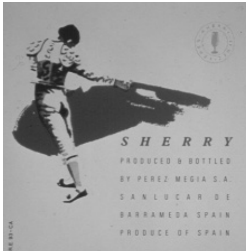
Fig. n.º 18.- Viñeta de torero realizando un lance de capa.

procedentes de España en general y de la comarca jerezana en particular. Se trata ahora de recrear las viejas claves románticas de una Andalucía definida casi exclusivamente por lo flamenco y lo taurino, puesto que estos arquetipos andalucistas se han convertido en los grandes símbolos transnacionales por los que la mayoría de los extranjeros reconocen a España y a sus productos comerciales.