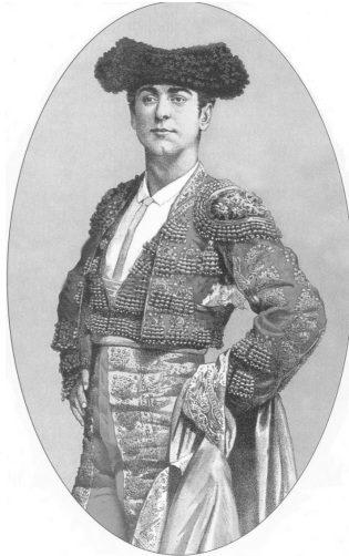
Fig. n.º 20.- Retrato de Mazzantini utilizado en una etiqueta.

En el abundante conjunto de ilustraciones vinateras donde se reproducen retratos de toreros, éstos se presentan en solitario,