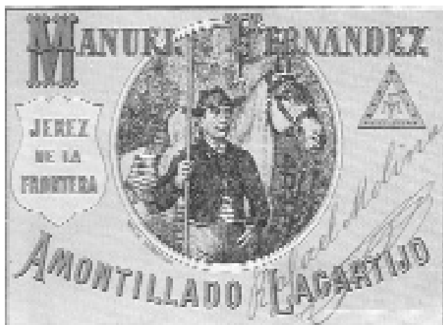
Fig. n.º 39.- Etiqueta del amontillado 'Lagartijo'.