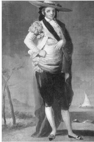
Fig. n.º 22.- Retrato dieciochesco de un personaje en pose de gallardía.

Todos estos artistas mantienen los cánones románticos instaurados por el grabado popular para representar al héroe taurino, el cual continúa captándose casi siempre de cuerpo entero, de pie y vestido de luces, quedando realzada su figura sobre fondos neutros, al tiempo que el personaje adopta esa pose de gallardía propiamente casticista que ya se observara en los retratos dieciochescos de Joaquín Costillares y Pedro Romero realizados por Juan de la Cruz y Antonio Carnicero