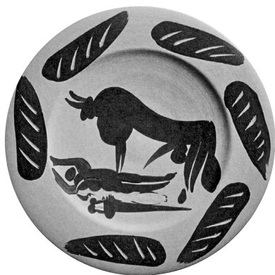
Fig. n.º 8.- Picasso: El torero muerto , 1957, cerámica pintada, 23,5 cm. de diámetro, fabricado en Madoura (Cat. Pág. 24).

Villauris tendrá para Picasso una importancia clave en el desarrollo de su obra pues ahí se encontró con unos alfareros de calidad excepcional –en especial los que trabajaban en la alfarería Madoura– que le permitieron desarrollar su interés por la cerámica, un arte con el que lograba, en primer lugar, investigar e identificar los elementos constantes de su obra a fin de seriarla y, en virtud de ello, producirlas a bajo coste, condición esencial para hacer llegar su arte a capas cada vez más amplias de la