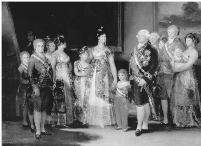
Fig. n.º 16.- La familia de Carlos IV . Francisco de Goya. Museo del Prado. Madrid. Varios personajes del cuadro goyesco participaron en el viaje regio por Extremadura y Andalucía en 1796. En el centro aparecen los reyes Carlos IV y María Luisa de Parma. Tras el monarca aparece el rostro de su hermano Don Antonio Pascual, casado con su sobrina, la infanta María Amalia –que no está en el retrato– y, de cuerpo entero, la efigie de Don Luís, príncipe de Parma, con su esposa la infanta María Luisa y el hijo de ambos. Entre Don Antonio Pascual y el príncipe de Parma se advina el rostro de Doña Carlota Joaquina, a quien los Reyes visitaron en Badajoz. A la izquierda de la Reina hay otros miembros de la familia, destacando en primer plano el Príncipe de Asturias, futuro Fernando VII. Todas las imágenes de este artículo han sido cedidas por el autor.

La Diputación tuvo en cuenta antes de nada qué había pasado en otras visitas regias a la ciudad. Se prescindió de las