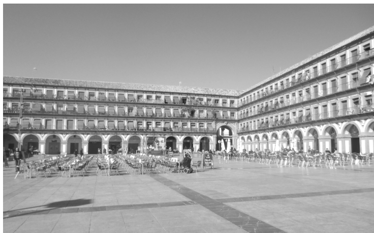
Fig. n.º 17.- Plaza de la Corredera de Córdoba , escenario de los festejos taurinos de 1796.

Mientras se buscaban por campos y ciudades andaluzas al ganado y a los lidiadores, se iniciaron a toda prisa las obras de acondicionamiento de la Plaza Mayor. Normalmente, cuando había corrida de toros, se construía un gran tendido que acortaba la plaza a la altura de la calle Odreros –junto a la Casa-cárcel del corregidor– y los arcos se cerraban con andamios que formaban los burladeros. Para esos tendidos se contrataron a los