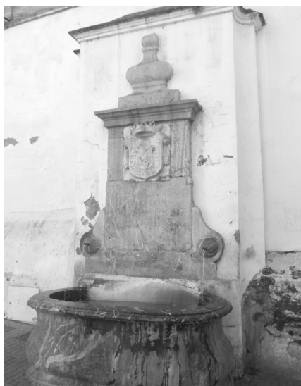
Fig. n.º 19.- Fuente erigida en la calle de la Feria de Córdoba –hoy calle San Fernando– con motivo de la visita de la familia de Carlos IV a la ciudad.

En este orden de cosas resulta especialmente llamativo el planteamiento de las corridas de toros. Oficialmente se hicieron