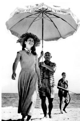
Fig. n.º 39.- Capa, R.: Françoise Gilot y Pablo Picasso en la playa de Golfe-Juan , verano de 1948, Museo Picasso de Antibes.