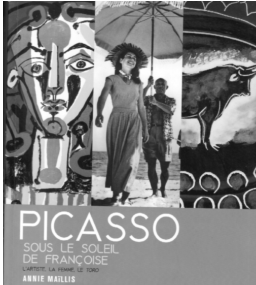
Fig. n.º 38.- Maïllis, Annie (2012): Picasso. Sous le soleil de Françoise , Nîmes, Musée du Vieux Nîmes et des Cultures Taurines, 184 págs. + ils. Avec le soutien du Conseil général des Bouches-du-Rhône.

L a profesora Maïllis desde que en 1998 publicara, con prefacio de Jorge Semprún, Michel Leiris l'écrivain matador (L'Harmattan) hasta este luminoso ensayo sobre Picasso bajo el sol de Françoise (que es también Catálogo de la Exposición que bajo el mismo título ha tenido lugar este mismo año de 2012 en el Museo de Culturas Taurinas de Nîmes 1 ),