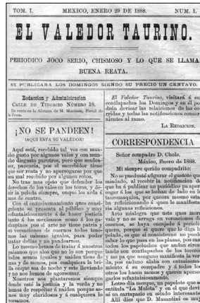
Fig. n.º 9.- Único ejemplar con tema taurino publicado en El Valedor , semanario publicado en 1888.

con el arribo del toreo de a pie, a la usanza española en versión moderna, el cual desplazó cualquier vestigio o evidencia del toreo a la mexicana, y reiterándoles esa necesidad a partir de los principios técnicos y estéticos que emanaban vigorosos de aquel nuevo capítulo, el mismo que en pocos años se consolidó, siendo en consecuencia la estructura con la cual arribó el siglo XX taurómico en nuestro país.