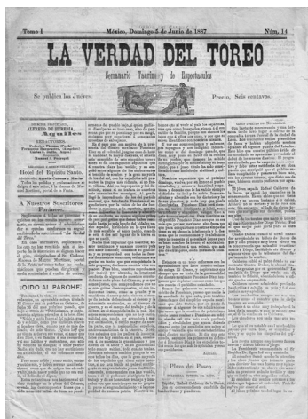
Fig. n.º 8.- Curioso ejemplar de La Verdad del Toreo , que se publicó en la ciudad de México en el curso de 1887.

un número cercano a los 120 títulos. Para terminar de entender a Ponciano Díaz, eje fundamental del toreo de finales del XIX, debo agregar que este personaje ha representado un interesante caso de investigación, pues, habiendo aprendido y aprehendido los quehaceres cotidianos en el ámbito rural, los puso en práctica ya estilizados en las plazas de toros. Esas puestas en escena estuvieron colmadas de la natural y espontánea asimilación de quehaceres cuya impronta se desarrollaba en estado puro, es decir, con esa original ejecución de suertes como colear y lazar