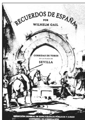
Fig. n.º 99.- Portada del libro Recuerdos de España por Wilhelm Gail, Dirección General de Espectáculos Públicos y Juego. Consejería de Gobernación.

dor de la Escuela de Tauromaquia de Sevilla. Esta obra se centra en el comportamiento del corazón de los toreros, sometidos a grandes presiones, peligros y sensaciones fuertes de angustia, así como a emociones positivas de satisfacción. El libro se adentra en las capacidades físicas que debe reunir un torero para ser capaz de aguantar el severo desgaste físico al que le somete la lidia de un toro. Pero no sólo se describe el comportamiento del corazón ante el ejercicio físico, sino que también se estudia el corazón antes de la corrida de toros, mientras el torero está sin