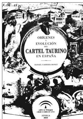
Fig. n.º 95.- Portada del libro Orígenes y evolución del cartel taurino , de Rafael Cabrera Bonet. Junta de Andalucía. Consejería de Gobernación y Justicia.

de la Consejería de Gobernación, y posteriormente de la Consejería de Justicia e Interior, de la Junta de Andalucía. Dicha Dirección General ha llevado a cabo una política de publicaciones sobre temas taurinos bajo diferentes enfoques (jurídicos, médico-veterinarios, estadísticos y divulgativos) que han dado lugar a varias decenas de títulos que son de gran interés para los estudiosos de los temas en cuestión y para los aficionados taurinos.