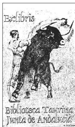
Fig. n.º 98.- Portada del libro Exlibris . Biblioteca Taurina. Junta de Andalucía.

los que se representa bajo diferentes aspectos el tema taurino. El libro viene precedido por un prólogo de Manuel Clavero Arévalo, que fue catedrático de Derecho de la Universidad de Sevilla y ministro en los últimos años de la década de los 70. También tienen carácter introductorio los dos estudios del autor, el primero sobre el origen y evolución de los exlibris y el segundo sobre el toro en los exlibris. En el primero, además de estudiar la historia de esta modalidad de estampa grabada que indica la propiedad de un libro o biblioteca, analiza a los principales