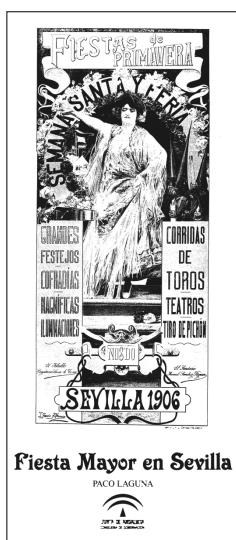
Fig. n.º 96.- Portada del libro Grandes Festejos. Fiesta mayor en Sevilla , de Paco Laguna, Junta de Andalucía, Consejería de Gobernación.

Manual práctico veterinario en los espectáculos taurinos , publicado en 1998, como los más específicos que hacen referencia a las encornaduras de los toros de lidia y sus anomalías, que han dado lugar a varias publicaciones en los años 1996, 2001, 2007 y 2011, realizadas por equipos de investigación relacionados con la Facultad de Veterinaria de la Universidad de Córdoba.