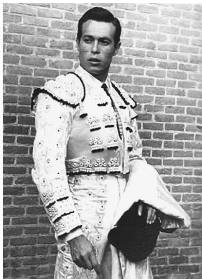
Fig. n.º 1.- Curro Romero preparado para hacer el paseillo. Apud. Jesús Gordillo, Joaquín (2013): Currolatría. Historia urdida de un dios menor , Barcelona, ediciones Bellatera.

Maestro, usted que es una persona con tanta experiencia como matador de toros ¿cómo ve el momento actual de la fiesta? ¿Está preocupado por su futuro? ¿Cree que puede tratarse de una crisis pasajera, como tantas veces ha ocurrido en la historia del toreo, o piensa que se trata de algo más serio?