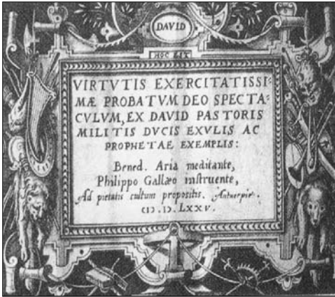
LÁM. n° 1. Portada de la serie de estampas y versos latinos de Arias Montano y F. Galle sobre el rey David.