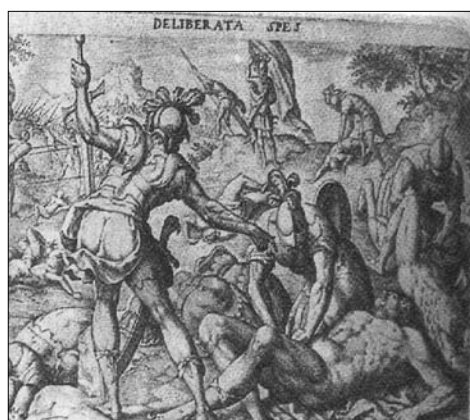
LÁM. nº 14. DELIBERATA SPES. David lucha contra los filisteos.