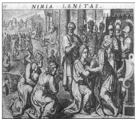
LÁM. nº 7. NIMIA LENITAS. David recibe a su hijo Absalón.