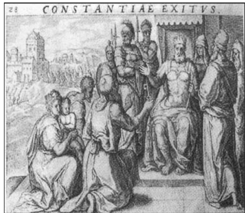
LÁM. n° 2. CONSTANTIAE EXITVS. David es nombrado rey de todo Israel.