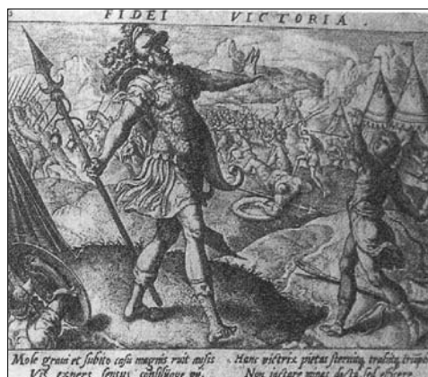
LÁM. nº 13. FIDEI VICTORIA. David lucha y vence a Goliat.