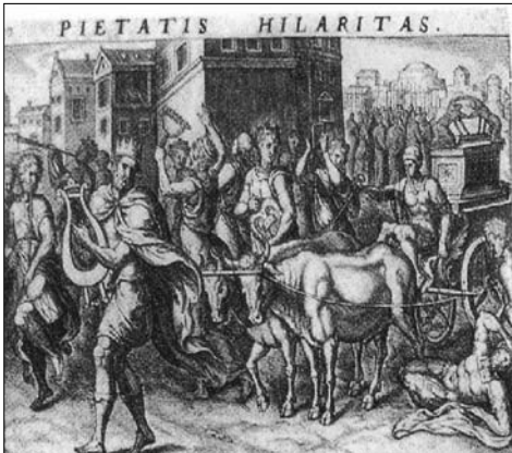
LÁM. n° 3. PIETATIS HILARITAS. Traslado del Arca y entrada triunfal del rey en Jerusalén.