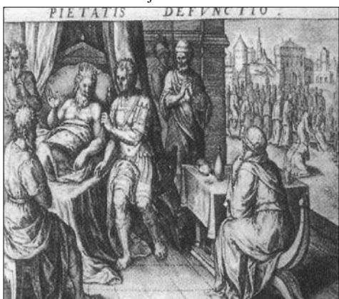
LÁM. nº 11. PIETATIS DEFVNCTIO. David entrega el reino a Salomón y le da las instrucciones sobre el gobierno.