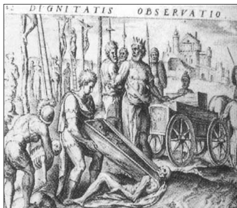
LÁM. nº 9. DIGNITATIS OBSERVATIO. David manda enterrar a los hijos de Saúl.