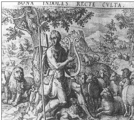
LÁM. nº 10. BONA INDOLES RECTE CVLTA. David como pastor apacienta el rebaño.