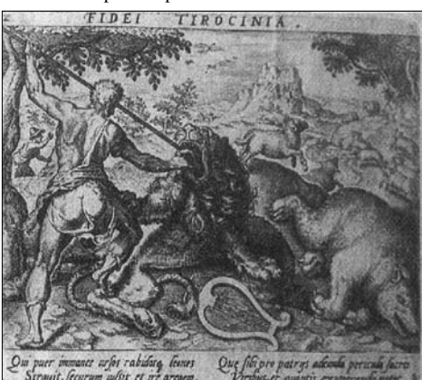
LÁM. nº 12. FIDEI TIROCINA. David defiende el ganado luchando contra el león y el oso.