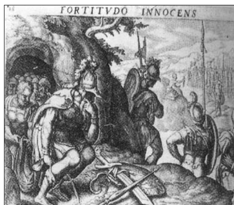
LÁM. nº 15. FORTITVDO INNOCENS. David se refugia en la caverna de Engadi y respeta la vida de Saúl.