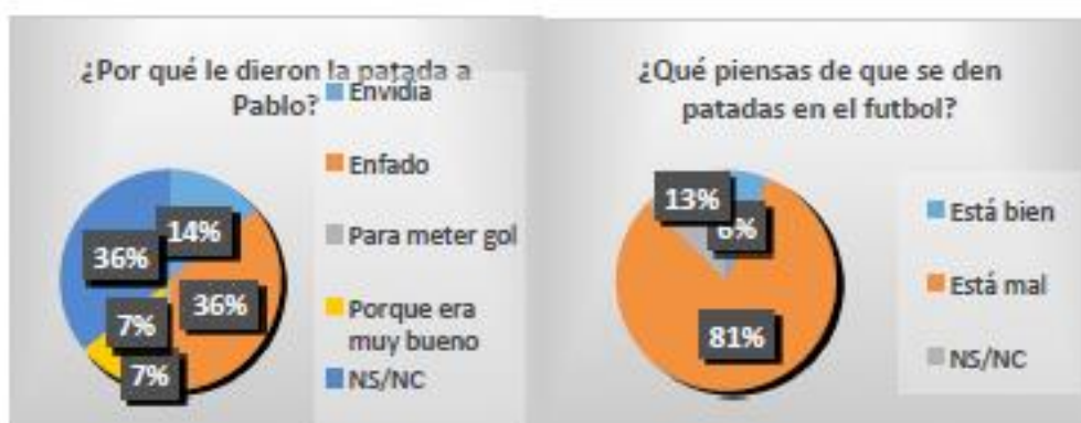
Gráfica 1. Resultados obtenidos tras la narración de la leyenda 1. Respuestas dadas por el alumnado

Leyenda 1. Un percance en el futbol: Esta primera leyenda fue narrada de forma individual, esto se hizo así para que las respuestas no fuesen copiadas de los compañeros/as, sino que diesen su propia opinión. Con el objetivo de comprobar que los estudiantes se estaban enterando de que iba la historia y de captar su atención, se les iba realizando diferentes preguntas sobre ésta. Al finalizar la historia se les plantearon dos preguntas (Gráfica 1), de las cuales se obtuvo una gran variedad de respuestas. De las contestaciones dadas en la primera pregunta planteada, se puede ver como la muestra se pone en el lugar de los personajes, mientras que en la segunda nos expresan su opinión sobre lo que ha pasado.