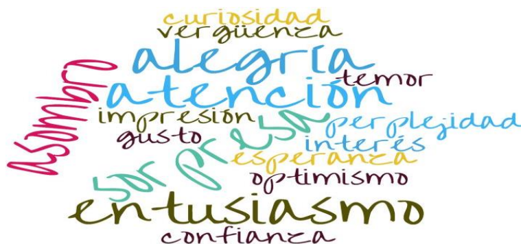
Figura 4. Nube de palabras de emociones en la audiencia

Ante la pregunta de las entrevistas de final de semestre: Si leíste en voz alta frente a un grupo, ¿utilizaste algún tono para matizar alguna emoción presente en la historia?, cito una de las respuestas: “El llanto se hacía presente aunque no leyera, fue de emoción, de alegría”.