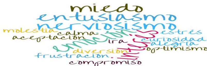
Figura 2. Nube de palabras de planeación de animación lectora

Las principales respuestas a la primera pregunta de la entrevista: ¿Cuáles fueron las emociones que experimentaste mientras realizabas la planeación de la(s) actividad(es) de animación para la LIJ? se pueden apreciar en la Figura 2.