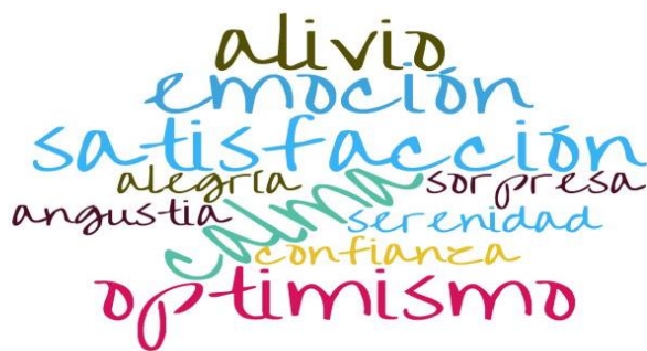
Figura 5. Nube de palabras de emociones finales de la animación lectora

Si bien las emociones ya descritas pudieran considerarse como lo esperado, el aprendizaje que ellos construyeron a lo largo de cada semestre no se limita al conocimiento teórico, sino que abarca otras habilidades que les permitirán desenvolverse con mayor seguridad en su entorno laboral. Poner en práctica sus conocimientos benefició el curso de la asignatura, manteniendo la motivación hasta el final. Sabemos que lo que nos emociona tiene toda nuestra atención y la animación a la lectura resultó emocionante y se mantuvo como prioridad en sus tareas.