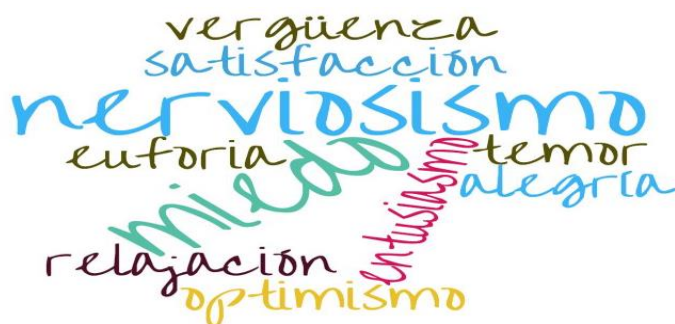
Figura 3. Nube de palabras de ejecución de la animación lectora

Se observó también que los estudiantes participaron con entusiasmo y compañerismo para lograr que cada una de las actividades lograra su objetivo: animar a la audiencia a leer. Incluso en algunos casos se vieron divertidos y satisfechos con sus interacciones entre ellos como estudiantes y también en las emociones que obtuvieron de los espectadores como se percibe en la Figura 4.