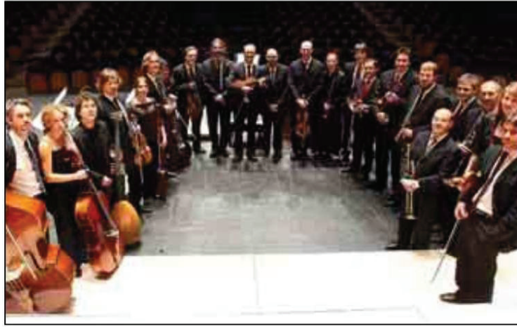
Los miembros de la Orquesta Barroca de Sevilla.

Durante su primer curso, la academia estudiará la música del siglo XVIII, bajo el título «La música en el Siglo de las Luces», centrándose en el estudio de la música de dicha centuria, su entorno y significado histórico, sus características