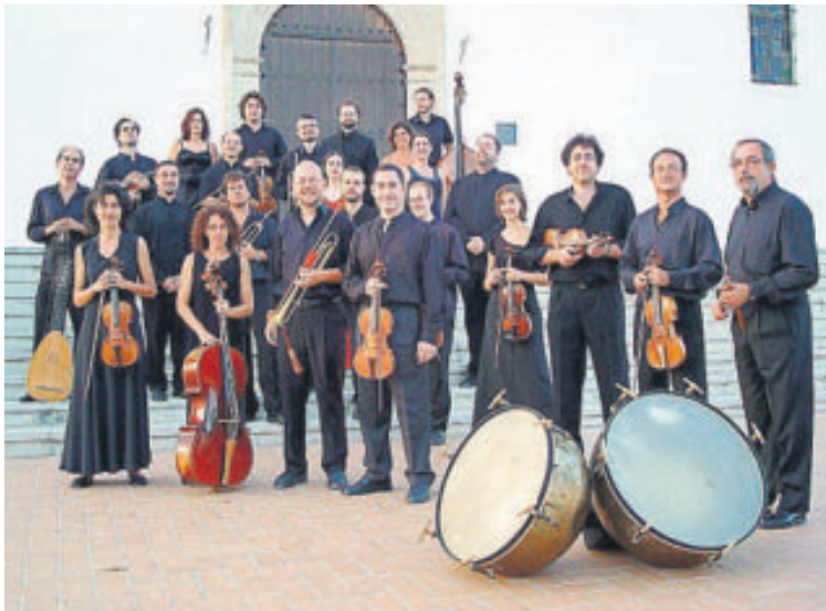
La Orquesta Barroca de Sevilla y el Cicus sostienen esta academia

Durante su primer curso, esta Academia va a estudiar la música del siglo XVIII, bajo el título «La música en el Siglo de