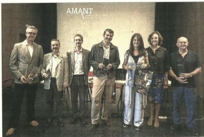
Presentación, ayer, de la Academia de Música Antigua de Sevilla.

«En diez años lo que ahora empezamos a construir debe ser un referente europeo que sirva, además, para poner en valor nuestro patrimonio musical; que debe ser investigado, editado y difundido», avanzó ayer, «tal y como, en colaboración con la Hispalense, se está haciendo con el proyecto Atalaya».