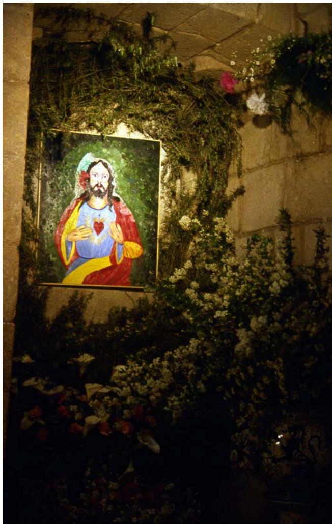
FIGURA 4. José Pérez Ocaña, exposição “A primavera”, 1982.

Ele retratou idosas com o rosto emoldurado pela dor e o luto que duram grande parte da vida das mulheres rurais de Cantillana, período no qual usam vestidos de cetim ou veludo pretos. Também pintou mulheres de meia-idade com vestidos de muitas cores, com flores nos cabelos e leques. Colocou maquiagem como elas, usou seus ornamentos e, em várias de suas combinações, as imagens das mulheres com a do próprio Ocaña se misturam (ver Figura 3). Ocupou o papel das enlutadas e das viúvas, venerou a sua Gloriosa Assunção de Maria na frente da Divina Pastora, que estava pendurada em sua cama; desenhou e pintou a Virgem de Montserrat. Também usou a voz como recurso artístico, pois as recitações andaluzas em coplas criaram um modo discursivo peculiar em Ocaña. São formas fragmentadas e dispersas, com uma cadência de repetição característica da sensualidade cultural andaluza.