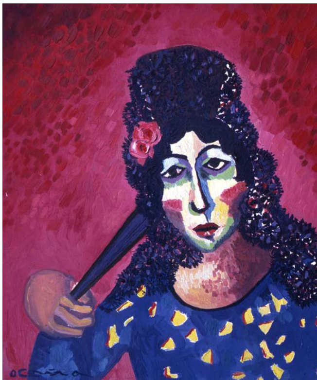
FIGURA 3. José Pérez Ocaña, exposição “A primavera”, 1982.

As fotos panorâmicas (Figuras 1 e 2) dão a dimensão da grandiosidade da exposição e não deixam dúvidas sobre a importância da religiosidade nas obras de Ocaña. O nome da exposição, “A primavera”, não é aleatório. Dentro da hierarquização dos sentidos que supõe cada expressão popular, a cultura andaluza concede um grande valor ritual a essa estação. A primavera anuncia as festas que se concentram em abril e maio, durante a Semana Santa e as Festas das Cruzes, as romarias e procissões que se sucederão até que chegue o outono. Os cheiros de azahar , a vela ou incenso, o som das procissões e o toque dos vestidos recriam um corpo festivo, comunitário, que foi objeto de uma especial atenção por Ocaña, que empregará seu próprio corpo como produção artística.