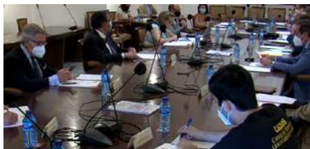
Pleno semipresencial de junio 2021

Estos plenos han tenido que adaptarse a la situación originada por el COVID-19. Los plenos de marzo y diciembre se celebraron de manera telemática garantizando las medidas sanitarias adoptadas por la COVID-19.