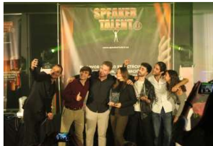
Final I Speaker Talent Universidad, 24 noviembre 2021.

La final para elegir al mejor orador se llevó a cabo en la Facultad de Ciencias Económicas y Empresariales el pasado 24 de noviembre.