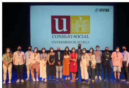
Becados por el Consejo Social de la US en la II edición del programa 3,2,1 Sputnik.

Destacamos la aportación económica para becar a 150 estudiantes que participaron en el programa 3,2,1, Sputnik, dirigido a jóvenes para formarles en las tecnologías exponenciales que van a cambiar el mundo.