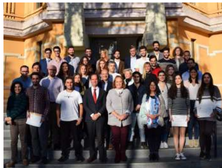
Programa Desarrolla Tu Talento.

Esta iniciativa centra sus esfuerzos en la colaboración con profesores y directivos de empresas para realizar actividades formativas enmarcadas en un programa para la detección del talento, desarrollo de competencias, acompañamiento y mentorización, usando como herramienta el coaching y el desarrollo de la inteligencia emocional