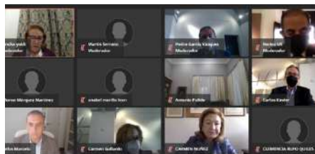
Pleno telemático de marzo de 2021.