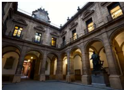
Interior de la Universidad de Sevilla.

del grado de cumplimiento de los objetivos generales y específicos contemplados en el Plan de Actuaciones 2021, en cada uno de los programas recogidos dentro de las cuatro líneas estratégicas establecidas.