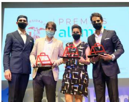
Entrega I premios Alumni US, 20 de julio de 2021. Auditorio CaixaForum Sevilla

Se lleva a cabo en colaboración con el proyecto Alumni del Vicerrectorado de Análisis Planificación Estratégica y va dirigida a los egresados, tanto juniors como seniors, de la US y se basa en la colaboración entre profesionales de referencia, directivos de empresas y mandos intermedios, con estudiantes recién egresados de la US.