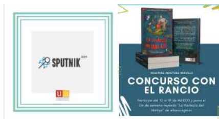
Ejemplos de campañas de redes sociales del CSUS en 2021

Un ejemplo de estas actividades ha sido la campaña de Compromiso Social, para dar a conocer la labor de las asociaciones y ONGs beneficiarias de la convocatoria de compromiso social, la campaña del 8M, la del día de la mujer y la niña en la ciencia, etc.