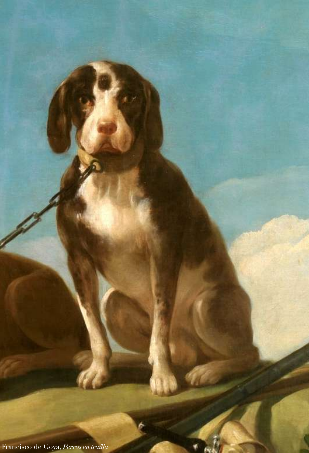
Francisco de Goya, Perros en tralla