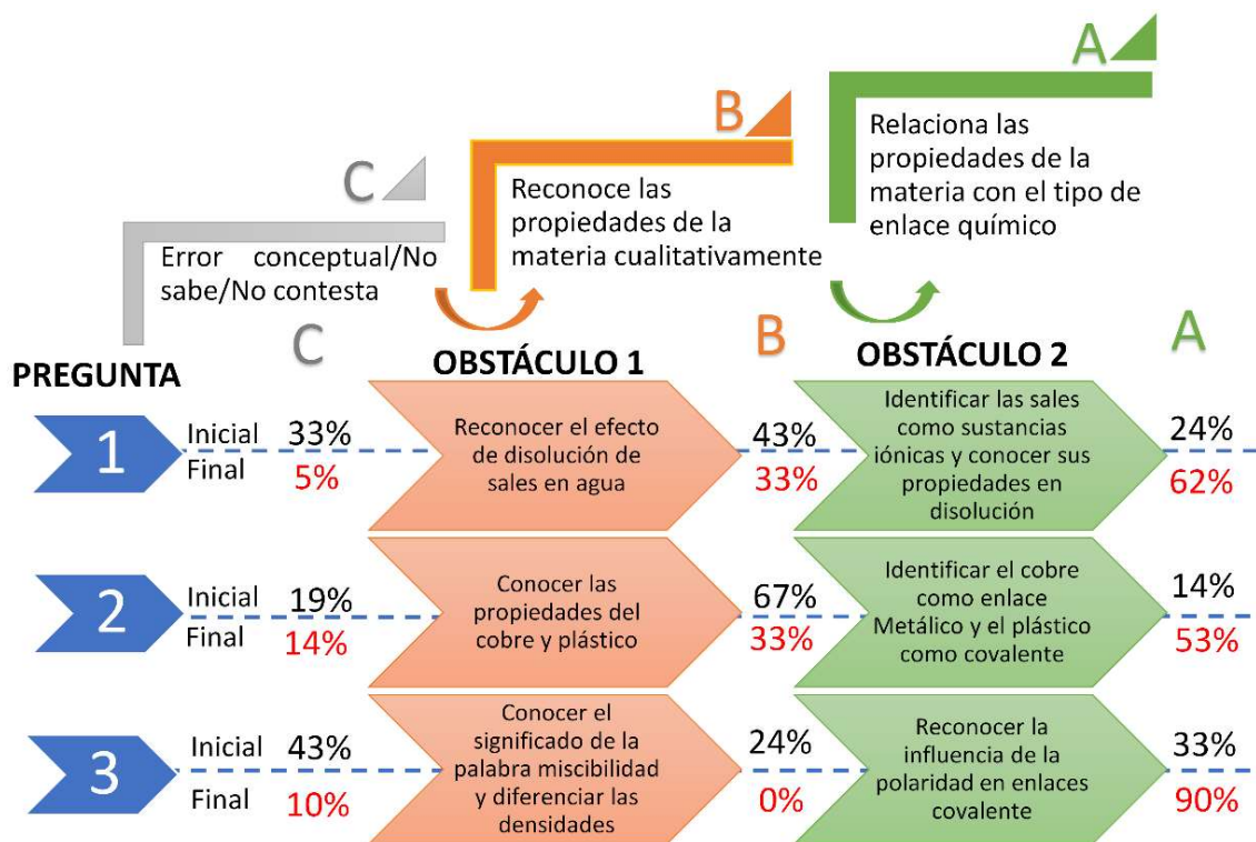
Figura 3. Escalera de aprendizaje y obstáculos asociados a las preguntas 1, 2 y 3 del cuestionario Inicial-Final 1 ¿Qué es qué?

Como se observa dichos modelos mentales se agrupan en tres grupos, siendo el A el más avanzado y certero. Los porcentajes en negro corresponden al número de alumnos/as cuyas ideas iniciales se encuentran en un mismo nivel, mientras que los porcentajes en rojo referencian las ideas de los estudiantes después de aplicar este CIMA. De forma general, se aprecia una tendencia hacia niveles mentales más complejos y certeros después de la aplicación del CIMA, siendo especialmente relevante la evolución de la pregunta 3. El 90% de los estudiantes fueron capaces de responderla adecuadamente, considerando la diferencia de polaridad del enlace covalente. Creo que esta diferencia tan acusada entre el antes y después se debe a que la pregunta no estaba formulada correctamente en el Cuestionario 1. Muchos de los estudiantes desconocían el significado de la palabra miscibilidad, lo que indujo a que no pudiesen contestar la pregunta en el cuestionario inicial.