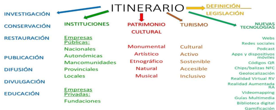
Figura 2. Mapa de contenidos

De igual forma, el mapa de contenidos de la asignatura tendrá su reflejo en la realización de estos trabajos.