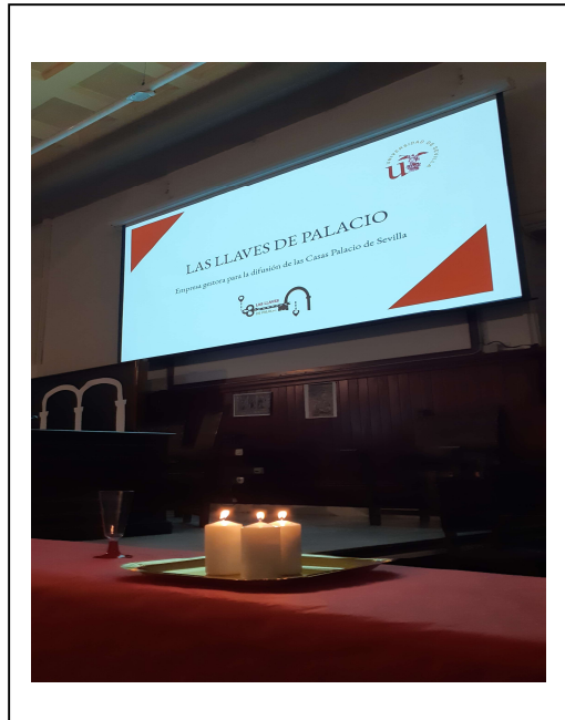
Figura 4. Presentación del Grupo 6

En muchos de los casos se han expuesto en la clase, favoreciendo la cercanía al alumnado asistente; si bien algunos lo hicieron online, y, si bien perdieron frescura a la hora de presentarlo, también resultaron atractivos.