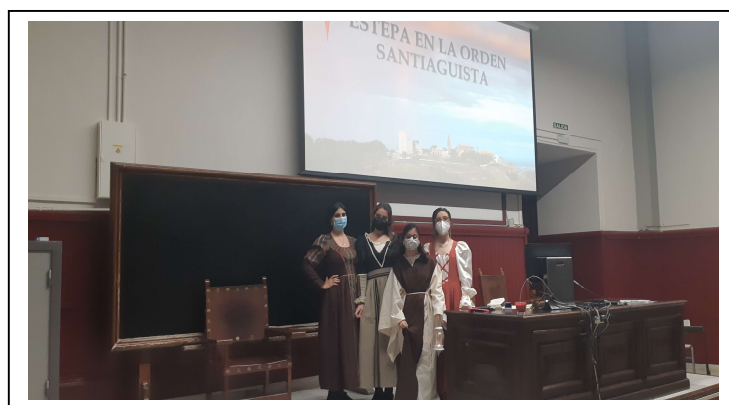
Figura 3. Presentación del Grupo 9

Las sesiones se realizaron conforme a lo previsto. Para la exposición de cada uno de los itinerarios (23 en total) se realizó un cronograma donde se recogían los días que expondría cada grupo y se ha seguido escrupulosamente. Respecto a los trabajos elaborados por los grupos de alumnos cabe decir que los resultados son también muy positivos, cubriendo las expectativas del profesor, así como de los propios alumnos que hacían el trabajo y de los que asistían a su presentación. Son los propios alumnos de cada grupo los que ofrecían la información e incluso incidían y reforzaban en contenidos de la asignatura (Finkel, 2008). Las presentaciones han sido muy dinámicas, participativas e innovadoras.