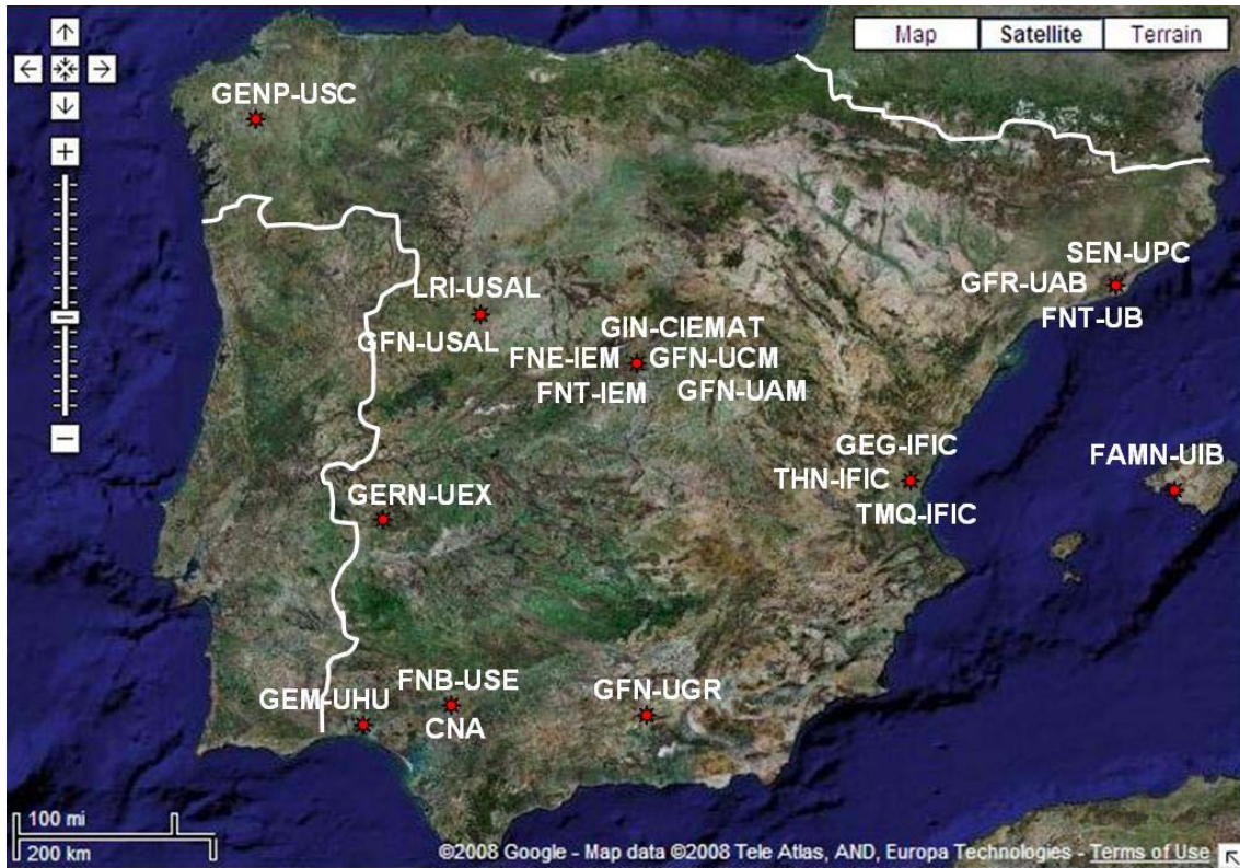
Distribución geográfica de los Grupos de la Red Temática de Física Nuclear