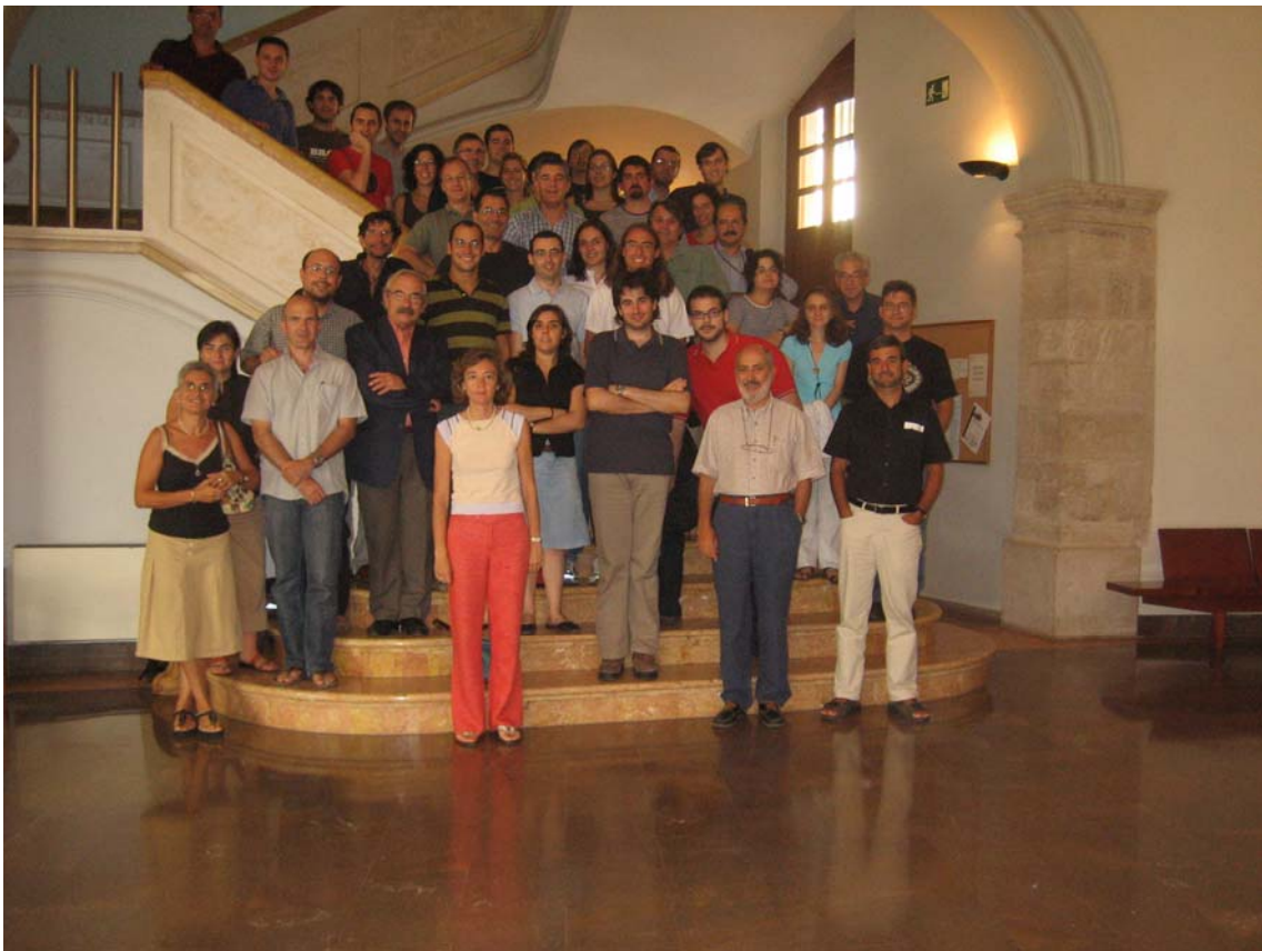
Participantes del I Encuentro de Física Nuclear celebrado en el Colegio Mayor Rector Peset en Valencia, del 6 al 8 septiembre de 2006