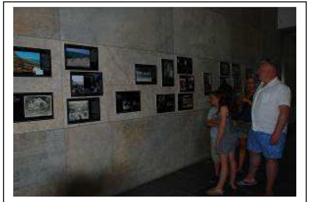
Imágenes de la exposición fotográfica "Retratos: Usos y Tradiciones en el Parque Natural del Estrecho" (Conjunto Arqueológico Baelo Claudia, del 15 de julio al 10 de octubre de 2013).