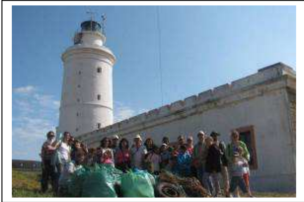
Grupo de voluntarios de la limpieza en tierra.