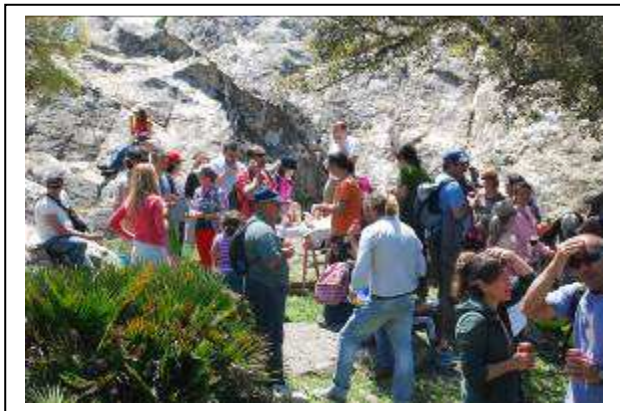
Celebración de la Romería de la Hierba de la Sangre. Degustación de aperitivo.