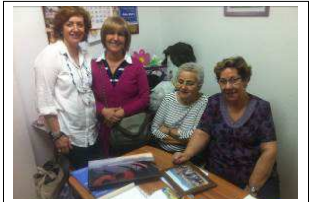
Sesión del taller etnográfico en la Asociación Aljaranda.