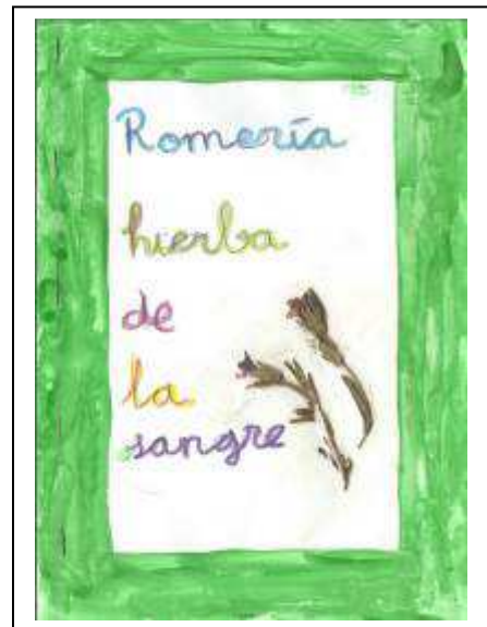
Imagen de uno de los cuadernillos realizados por los alumnos de primaria del colegio Campiña de Tarifa, de Bolonia, como parte de las actividades realizadas en estas Jornadas.