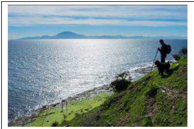
Fotografía ganadora de la categoría etnográfica. "Caminando" de Serafín Sánchez Marín.