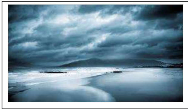
Fotografía ganadora de la categoría terrestre. "Cianotíпия de Los Lances" de Francisco Manuel Esteban Moya.