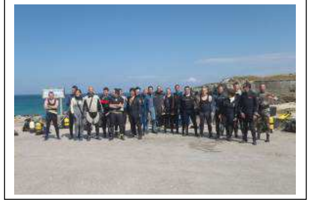
Grupo de voluntarios de la limpieza en mar.