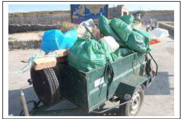
Imagen de la retirada de la basura recogida.