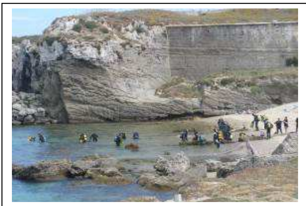
Imagen de la entrada en el mar de los buzos voluntarios al inicio de la limpieza de fondos.