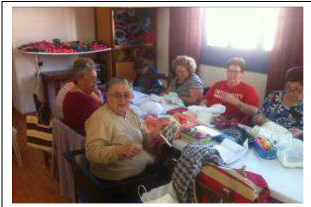
Sesión del taller etnográfico en el Hogar del Pensionista.