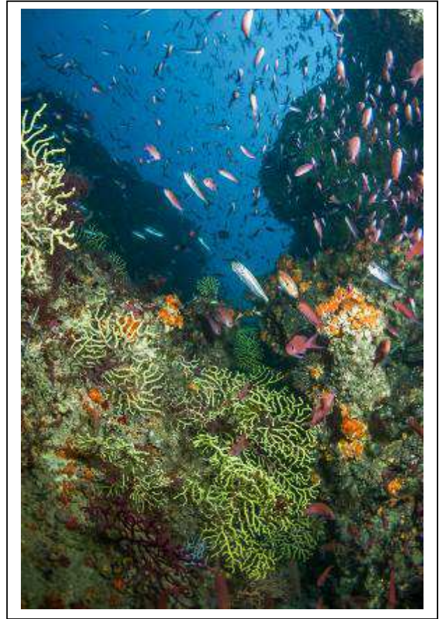
Fotografía ganadora de la categoría marina-submarina. "Dardos en el azul" de Miguel Fernández Varela.