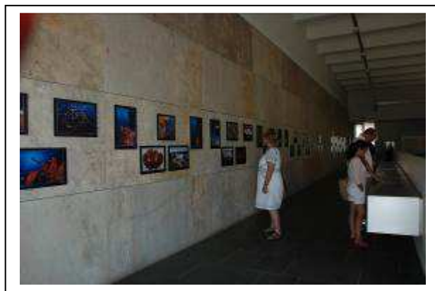
Exposición de una selección de fotografías de la I, II y III edición del Concurso Fotográfico del Parque Natural del Estrecho en el Conjunto Arqueológico Baelo Claudia (del 15 de julio al 10 de octubre).