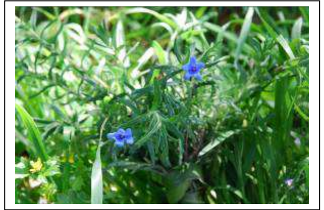
Imagen de la Hierba de la sangre ( Glandora prostata ) usada tradicionalmente para luchar contra las alergias causadas por la humedad, el catarro, la fiebre y subidas de tensión.