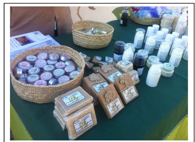
Productos cosméticos "Algas de Bolonia" elaborados con algas de arribazón de la zona.