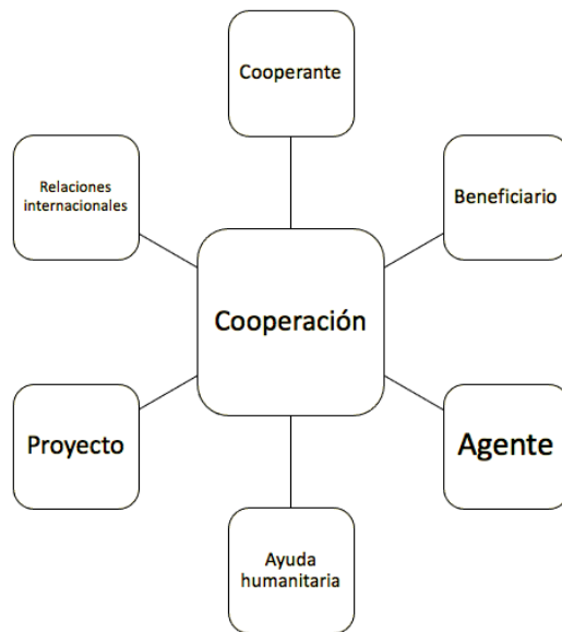
Figura 4. Ejemplo de campo léxico. Fuente: elaboración propia a partir de Coseriu (1977)

Si estableciésemos el campo semántico del concepto cooperación, obtendríamos un campo semántico de tipo abierto, incluyendo palabras relacionadas con este ámbito. Un ejemplo podría ser el siguiente (Figura 4):