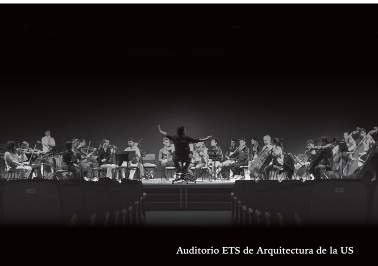
Auditorio ETS de Arquitectura de la US