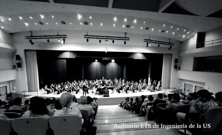
Auditorio ETS de Ingeniería de la US