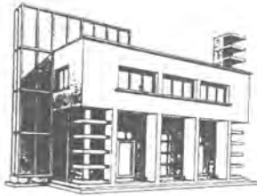
Edificio de las Comunidades Artesanas de Turín, 1927-28.