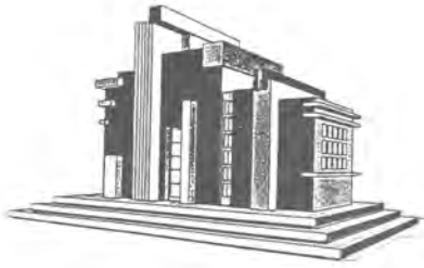
Bar futurista: 1920.