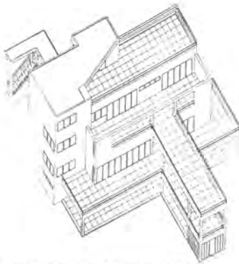
Casa Gentinetta. Chexbres, 1937