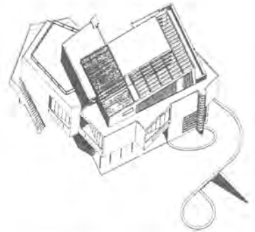
Casa de Arnulfo Córdoba. Tacoronte, 1952