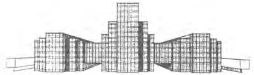
Ordenación urbana de la Plaza del Estadio. Turín, 1922.