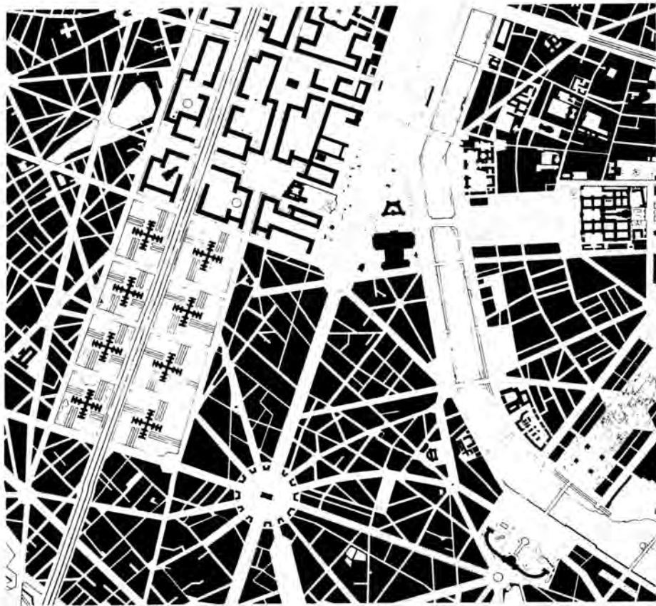
Le Corbusier, Paris, Plan voisin, 1925.