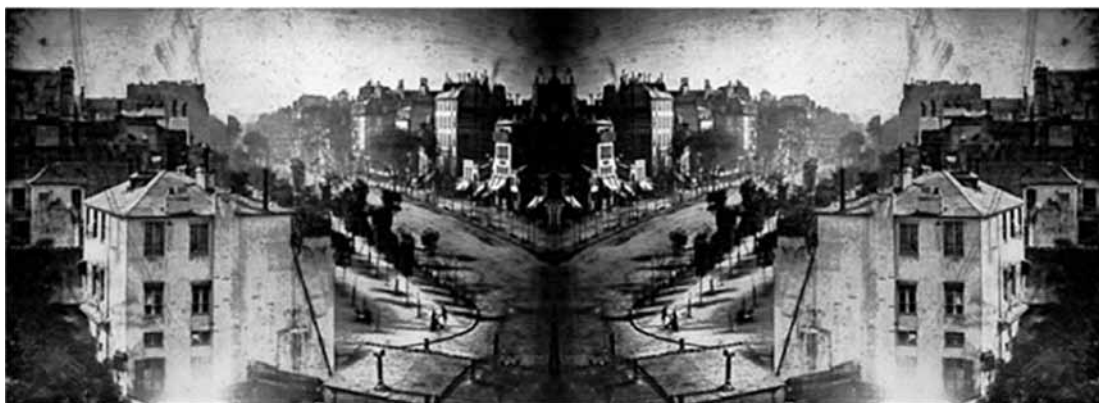
Fig. 4 Montaje del autor. Simetrías y antisimetrías. Boulevard du Temple. Imagen-Espejo.

Un interior que alberga casas, zapatos, sueños, dobles, alas de mariposa.