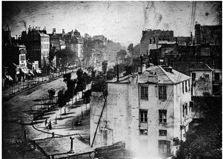
Fig. 1 Boulevard du Temple, verano de 1838, Paris, 3ra. de Arrondissement, Daguerrotypie.

https://dx.doi.org/10.12795/astragalo.2016.i21.10