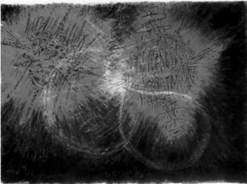
Fig. 3 Fotograma del film de Bruno Taut de 1919 "Der Weltbaumeister/Architektur-Schauspiel für symphonische Musik".

(Narración en off, del alemán nuestra traducción, minutos 8'30" a 11', "Der Weltbaumeister" Bruno Taut.