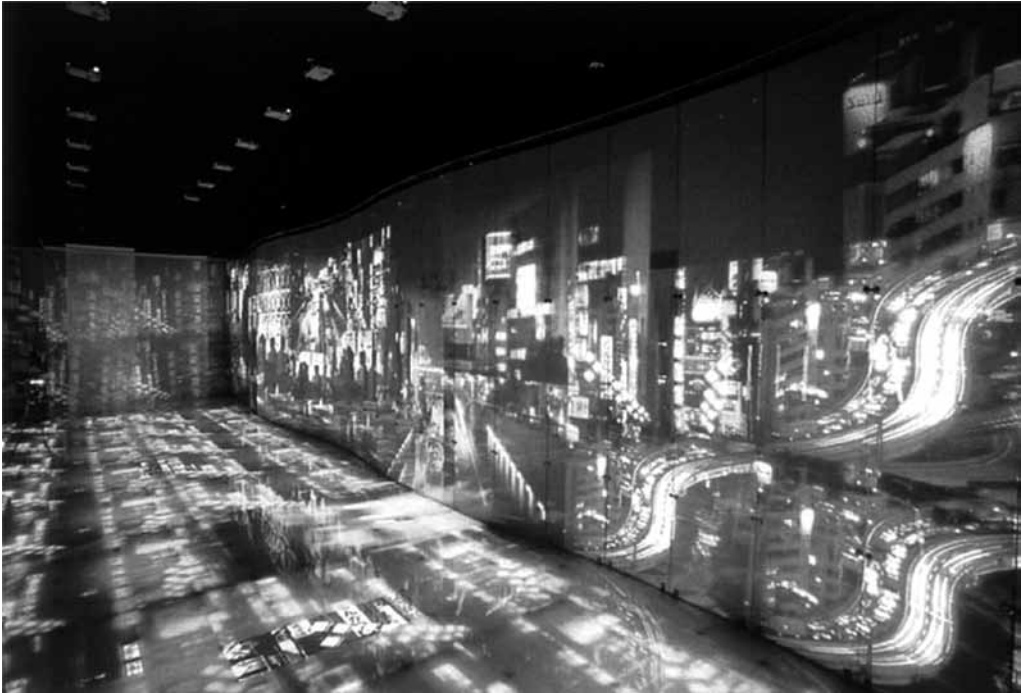
Fig. 6 Dreams Room - Toyo Ito. 1991. London Exhibition Visions of Japan. Victoria and Albert Museum.

gocitadas por un discurso hegemónico, que se escapa del control incluso cuando son escritas con la consciencia de la misma mano que escribe (desde el backstage ).