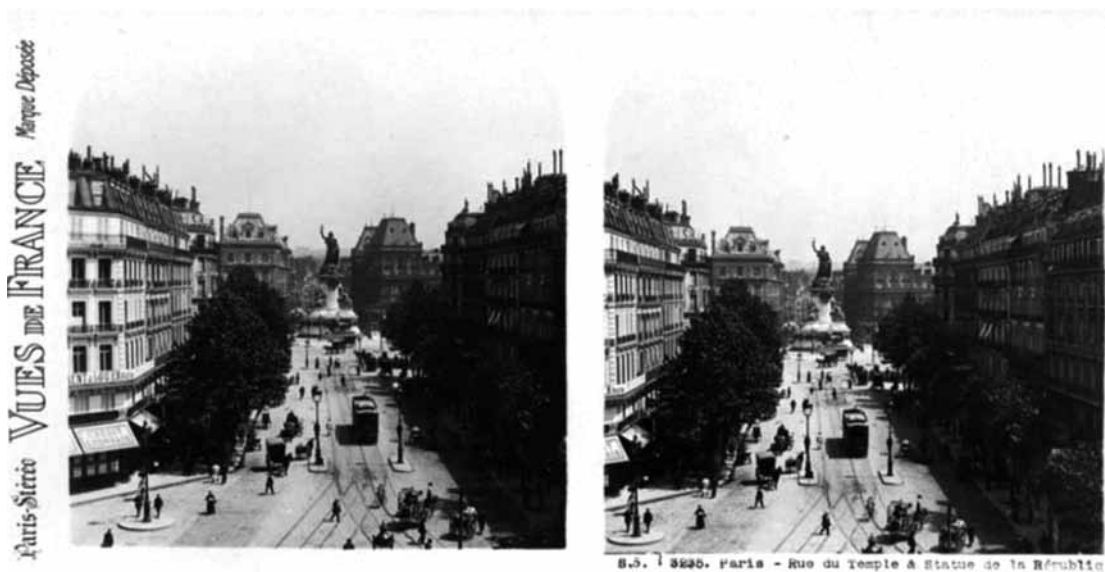
Fig. 2 Imagen Estereográfica del Boulevard du Temple (cerca de 1900).

Es este aspecto, que se enmarca en lo formalista pero que se enreda en las reflexiones de Lacan sobre el imaginario 14 , será la clave de nuestros supuestos, generando nosotros una serie de escenas de deseos invertidos en la mirada, como que fuera el tiempo quien mirara hacia la cámara y se preguntara cuáles serían las significaciones imaginarias para una sociedad considerada (en nosotros, occidental), pues ciertamente, en realidad, son el mundo.