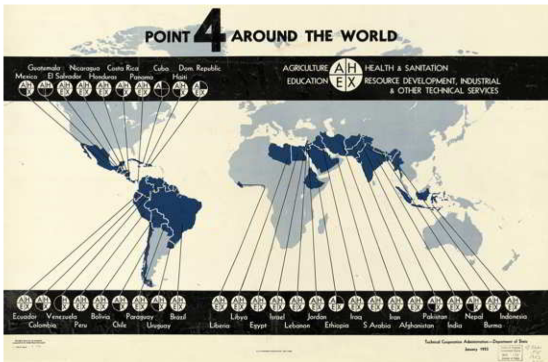
Fig. 1. Point 4 around the world. Administración de Cooperación Técnica de los Estados Unidos, enero de 1953.

urbana entre sus proyectos de desarrollo. Describiremos el programa Sitios y Servicios , implementado por esta institución en treinta y siete países de América Latina, África y Asia entre los años 1972 y 1985. De esta manera, revisaremos cómo la arquitectura y el diseño urbano fueron parte de una estrategia para erradicar la pobreza absoluta , a la vez que extendieron lógicas del capital –con procesos de reestructuración espacial y normativa orientadas al mercado– en territorios muy diversos.