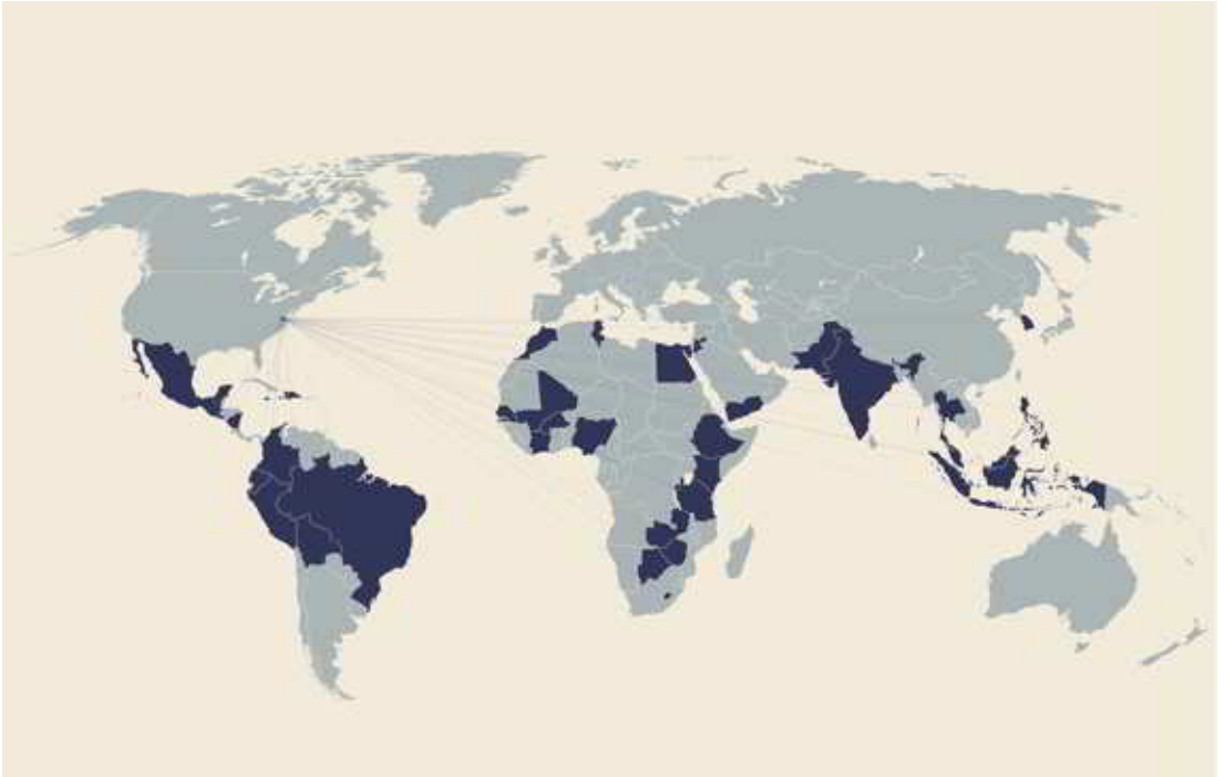
Fig. 3. El mapa presenta la ubicación de alrededor de 300 operaciones de Sitios y Servicios desarrolladas entre 1972 y 1985 por el Banco Mundial en más de 140 ciudades de 37 países en vías de desarrollo.

co para la siguiente década (World Bank 1972). Posteriormente, en 1975, McNamara se dirigiría a su Junta de Gobernadores proclamando que: “En el fondo, las ciudades existen como expresión de un intento del hombre por alcanzar su potencial. Es la pobreza la que contamina esa promesa. Es la tarea del desarrollo poder restaurarla” (World Bank 1981, 333). Hasta 1972, el Banco no había intervenido en el ámbito de la vivienda de bajo costo dado que se consideraba un sector de alto riesgo económico, donde difícilmente el país beneficiado podría devolver el préstamo en el plazo establecido.