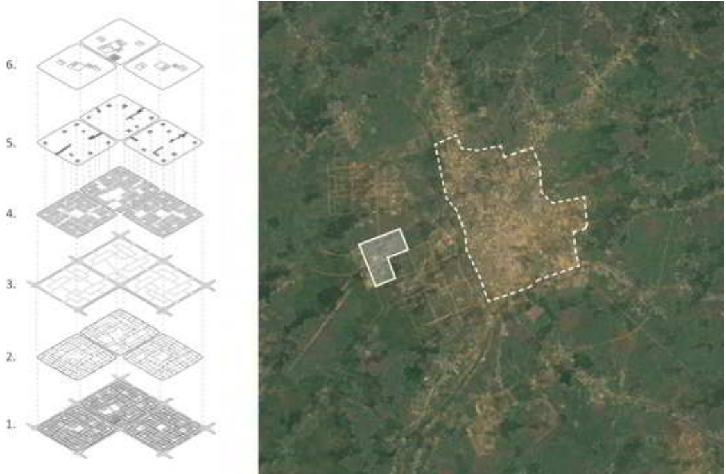
Fig. 6 Izquierda: Diseño urbano del proyecto de Sitios y Servicios para la ciudad de Owerri, en Nigeria. El fragmento urbano consideraba equipamiento comunitario que apoyaría el desarrollo social de los nuevos habitantes. 1. Proyecto de Sitios y Servicios en Owerri / 2. Redes de alcantarillado, agua potable y electricidad. / 3. Calles conectoras y circulación interna / 4. Predios y unidades habitacionales. / 5. Plazas y paseos / 6. Equipamiento comunitario. Redibujo: Carlos Díaz en base a información del Banco Mundial. Derecha: Foto aérea de la ubicación del proyecto de Sitio y Servicios en relación con la ciudad de Owerri hacia 1985.

espacios para colegios, mercados, zonas para pequeñas industrias, centros de salud, centros de formación técnica y espacios para el culto religioso, plazas y parques infantiles, (figura 6) los que se adaptaban y traducían a distintos contextos culturales del mundo. Sin embargo, si bien estas piezas se planificaban como unidades con cierto grado de autosuficiencia, una de las críticas a estas operaciones fue que –por distintos motivos– no se lograban construir las instalaciones, y los barrios se debían ir completando incrementalmente a lo largo de los años, teniendo sitios en desuso reutilizados con muy