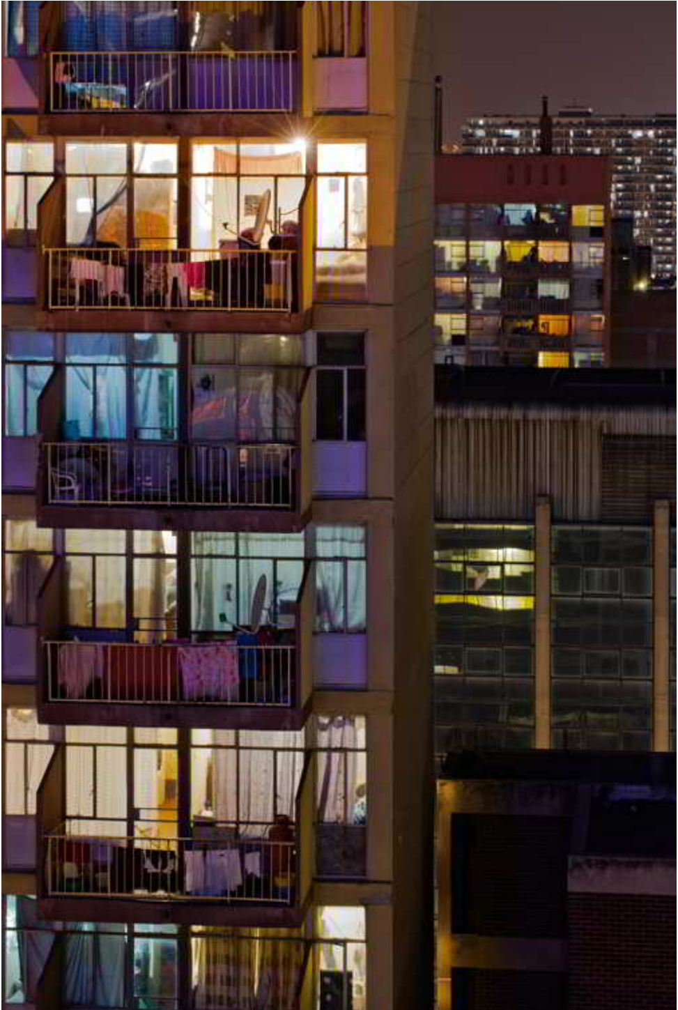
L F Krige