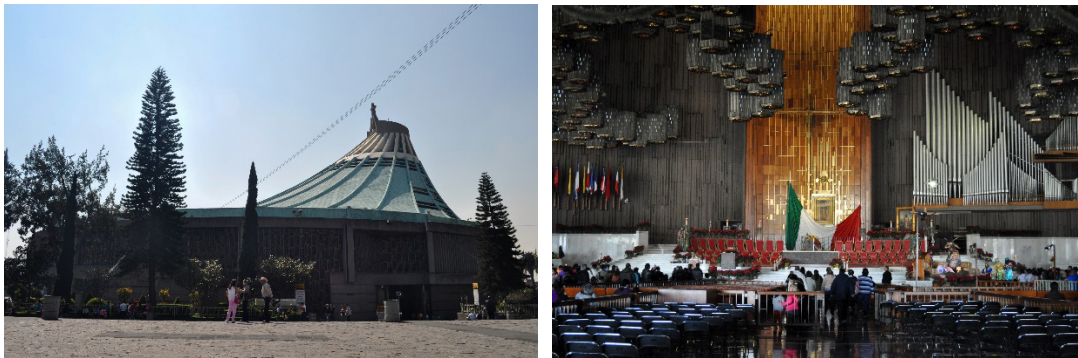
1 y 2. Exterior e interior de la Nueva Basílica de Guadalupe, Ciudad de México.

La nueva construcción del arquitecto Pedro Ramírez Vázquez 12 se edificó en el extremo poniente del atrio virreinal, a fin de que ambas construcciones pudieran seguir utilizando la extensa plaza. Además, ha de recordarse que esta gran plaza era el remate de un importante eje urbano, la llamada Calzada de los Misterios, cuyo origen mesoamericano se remite a la calzada artificial que unía el borde norte del lago de Texcoco con los islotes de México-Tenochtitlan. Por esta razón se respetó la primacía del gran atrio, el cual no sólo serviría de vestíbulo al conjunto religioso –pues además de la primera basílica, se encuentra un convento de capuchinas y una escalinata que conduce a la cercana capilla del Pocito– sino también para llevar a cabo celebraciones masivas al exterior, cuando la capacidad del interior del templo se viese superada.