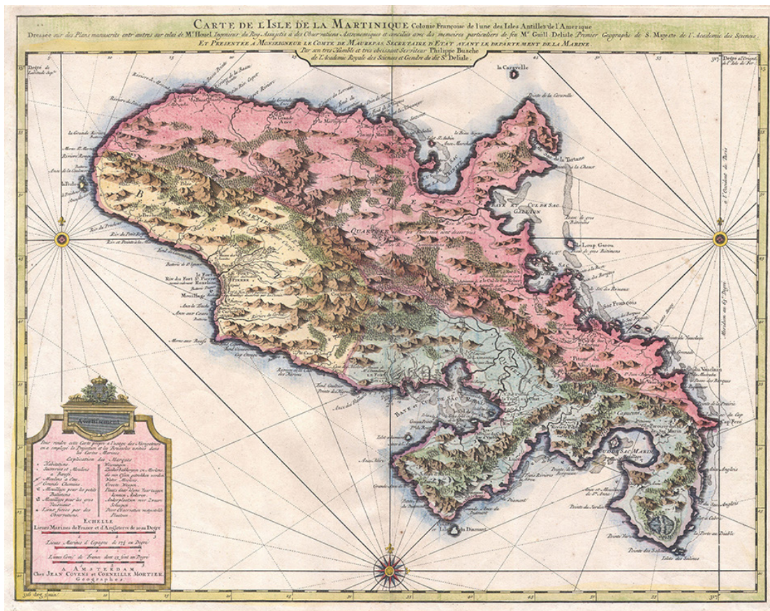
Figura 3: Mapa colonial francés de Martinica del Atlas Nouveau de Covens & Mortier, 1942.

debe considerar la territorialidad y la necesidad de desaprender los esquemas impuestos para construir un nuevo humanismo.