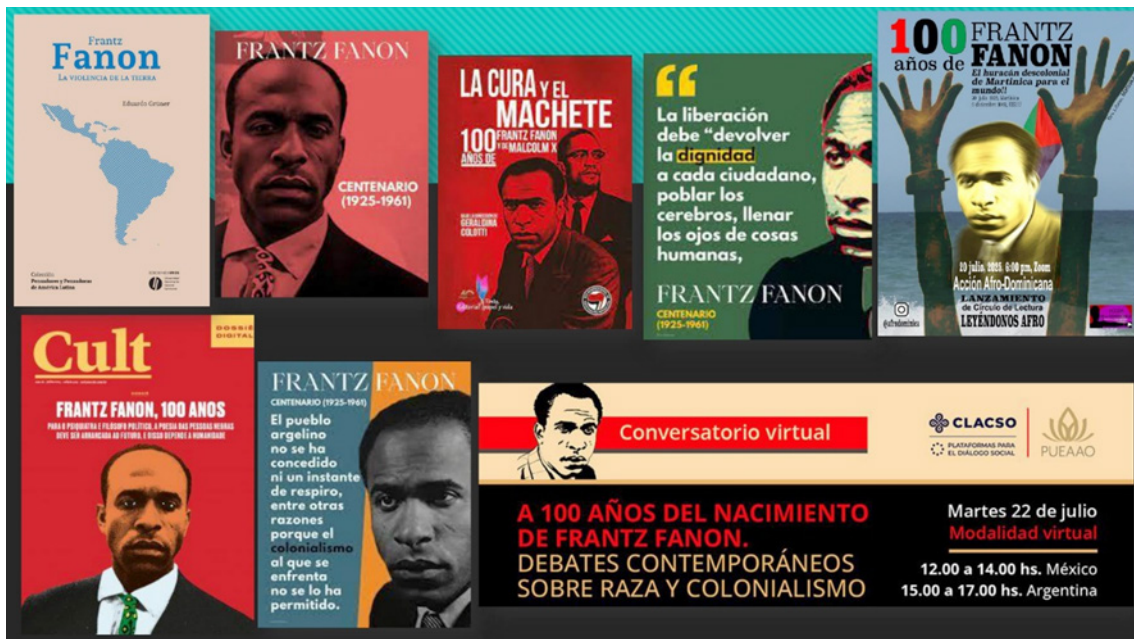
Figura 1: Diferentes formatos y eventos en conmemoración de los 100 años del nacimiento de Fanon.

Para esta ocasión en cambio, nos proponemos desde la geografía crítica indagar en algunos pasajes de la obra de Fanon la dimensión espacial. Consideramos necesario este tipo de reflexiones para poder llevar a Fanon a nuestras disciplinas, actividades de docencia, investigación y extensión. La idea no es forzar a Fanon en este ejercicio de transferencia de su pensamiento a la geografía. Ni tampoco desviar sus postulados. Por el contrario, buscamos construir algunas líneas de análisis en ese diálogo, para acercar la obra de Fanon a la Geografía y al resto de ciencias sociales para repensar desde su (re) lectura el mundo de las ideas y de la praxis.