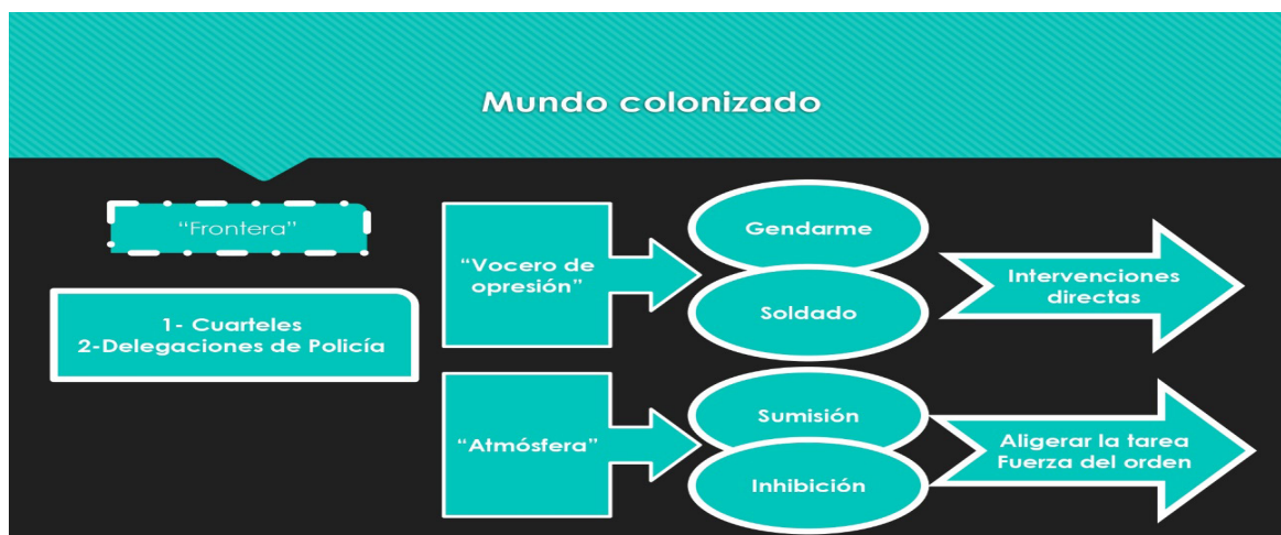
Figura 5. Esquema de control del espacio colonial.

Para Fanon (1963) el mundo colonizado es un mundo cortado en dos partes. La línea divisoria, construye fronteras y límites. Estas líneas se encuentran representadas materialmente por los cuarteles y las delegaciones de policía. En las colonias, el interlocutor válido e institucional del colonizado, el vocero del colono y del régimen de opresión era el gendarme o el soldado (Fig. 5).