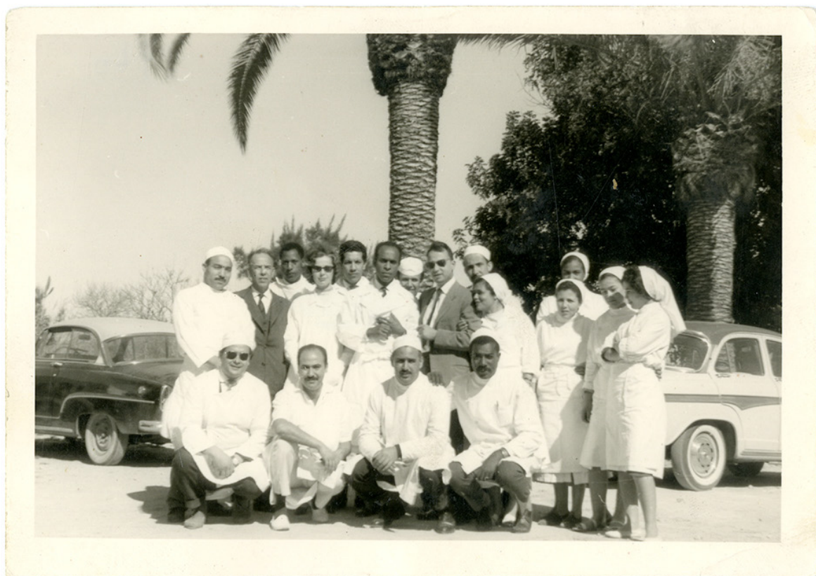
Figura 4: Frantz Fanon y su equipo médico en el Hospital Psiquiátrico Blida-Joinville en Argelia, donde trabajó entre 1953 y 1956. Frantz Fanon Archives / IMEC. Fuente: Instituto Tricontinental de Investigación Social. Año 2020

En el año 1945, Fanon vuelve a Martinica a trabajar en la campaña electoral de su maestro Aime Césaire, uno de los creadores de la teoría de la negritud. En el año 1947 retorna a Francia, a través de una beca de Estado, para estudiar medicina y psiquiatría. Estudió en Lyon y se graduó como psiquiatra en el año 1951 otorgando importancia al estudio de lo cultural en el tratamiento de la psicopatología. En el año 1952 publica su primer libro Piel negra, máscaras blancas . y en el año 1961 se publica Los condenados de la tierra . Por su parte, en el año 1953 asume como Jefe de Servicio en el Hospital psiquiátrico de Blida – Joinville en Argelia (Fig. 4), donde revolucionó el tratamiento, introduciendo prácticas de terapia social, basándose en la idea de la relevancia de lo cultural tanto para la psicología normal como para la patología (Bidaseca, 2025)