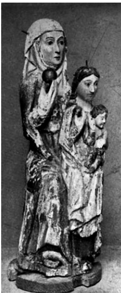
Figura 10. Santa Ana, la Virgen y el Niño, iglesia conventual de Santa Ana, Dos Hermanas (J. Hernández Díaz).

del siglo XIV 110 , y que nos puede dar una idea de cómo pudiera ser originalmente el grupo de Santa Ana y la Virgen —completamente vestido— de la iglesia de Santa Ana de Triana en Sevilla.