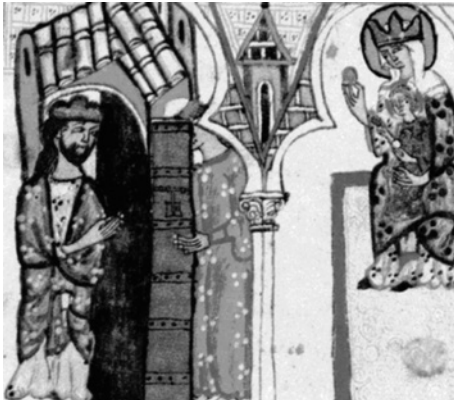
Figura 8. Cantiga 292: el orfebre Jorge de Toledo.

Desde el punto de vista del culto, esta tipología ejemplificada en la imagen de la Virgen de la Sede de la catedral sevillana fue el modelo frecuente de Virgen sedente o Maistas realizada por medianos escultores y otros de inferior categoría en todo el ámbito del antiguo reino de Sevilla, como veremos más adelante. Resulta curioso hallar en las parroquias de pequeñas poblaciones del alfoz de Sevilla humildes iconas sedentes de María que han pasado de ser imágenes de culto a imágenes de devoción en los tiempos modernos.