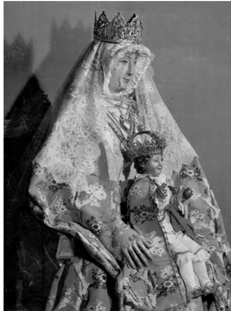
Figura 2. Virgen de los Reyes, Capilla Real, catedral de Sevilla.

Tanto la imagen de la Virgen de los Reyes como el Niño –que portaba en el lado derecho y después se colocó entre sus brazos– consisten en dos maniquíes de madera de cedro recubiertos de pergamino con sus articulaciones en madera de encina, cabeza y manos policromadas y cabellera de hilos de oro. Aparecen vestidas y la Virgen calza unos chapines de cordobán en los que aparece la flor de lis y la palabra “Amor” rodeada de estrellas. Teresa Laguna ha relacionado el mecanismo que movía la cabeza y articulaciones de estas imágenes con la rueda dentada que dibujó Villard de Honnecourt en su famoso manuscrito (f. 22 v.) para ilustrar un águila móvil en forma de atril 24 . Es decir, una rueda en torno a la cual aparecieron restos de “una correa sin fin” como fue dado a conocer por el profesor Hernández Díaz en el pasado siglo 25 aun cuando hoy día dicho artificio se encuentra inutilizado 26 .