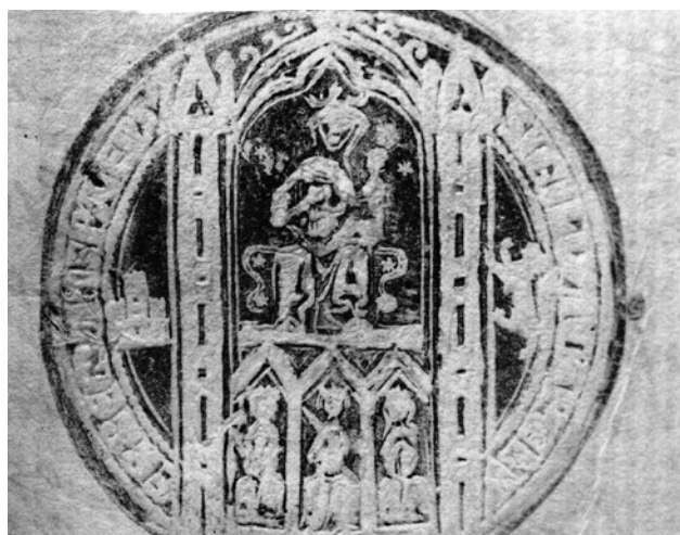
Figura 1. Representación de la Capilla Real de la catedral de Sevilla en un sello de fines del siglo XIII, Archivo Catedral de Sevilla (M. J. Sanz Serrano).

“semeja que está viva en carne” como dice un manuscrito copiado varias veces por los historiadores sevillanos 17 y que fue estudiado minuciosamente por Javier Martínez de Aguirre 18 .