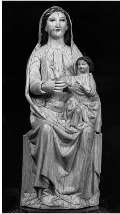
Figura 6. Virgen de las Batallas, catedral de Sevilla.

Otras imágenes sedentes en marfil son las del Museo de San Marcos de León y la del monasterio benedictino de El Salvador en Palacios de Benaver (Burgos) que tienen en común la actitud del Niño en bendecir 65 . Según Joaquín Yarza, el vano que se encuentra en la base indica que se fijaría en un lugar pero raramente en el arzón del caballo con la dificultad de transporte y arreos guerreros en el fragor del combate 66 . Pudo ser probablemente en el asta de un estandarte o bien rematando un asta como las cruces que acompañan a la bandera de Santa María y llevan los caballeros cristianos que entran a la carga para derrotar a los benimerines en una miniatura de la cantiga 181 67 . En Castilla hubo varias estatuas de la Virgen conocidas como “Virgen de las Batallas” que acompañaban a los caballeros en la guerra protegiéndolos contra todo mal gracias al poder de su imagen, como acontece en la historia narrada en la Cantiga 297, donde se nos habla de “una imagen muy bella” que cayó en manos de un hereje que no creía en su poder 68 . El profesor Yarza se preguntaba a partir de qué momento aparece esta obra en Sevilla como Virgen de las Batallas y quién es el primero en darle tal denominación 69 .