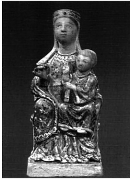
Figura 11. Virgen de Aguas Santas, iglesia parroquial de Villaverde del Río.

Ahora bien, si seguimos indagando por el antiguo reino de Sevilla, en la parroquia de San Bartolomé de la localidad de Cumbres de San Bartolomé en la provincia de Huelva, hallamos una interesante imagen sedente