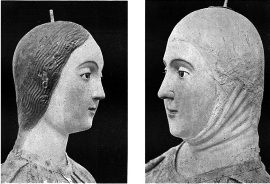
Figura 5. Cabezas de la Virgen y Santa Ana, iglesia parroquial de Santa Ana de Triana (J. Hernández Díaz).

estilísticamente con la Virgen de San Clemente 57 . Sin embargo, cabría preguntarse hasta qué punto las imágenes no hayan sido mutiladas en el primer cuarto del siglo XVII, cuando fueron restauradas por el escultor Francisco de Ocampo con objeto de componer el grupo que conocemos hoy con un Niño moderno, coronas y vestiduras barrocas ya que el maniquí es moderno. Además, si lo comparamos con la imagen de Santa Ana, la Virgen y el Niño de la iglesia conventual de Santa Ana en la localidad sevillana de Dos Hermanas, datada a comienzos del siglo XIV 58 , abundamos en la hipótesis de que una imagen semejante de la iglesia parroquial de Santa Ana de Triana haya sido mutilada para acomodarla al gusto de las devociones barrocas.