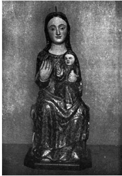
Figura 9. Virgen de Valme, iglesia parroquial de Santa María Magdalena, Dos Hermanas (J. Hernández Díaz).

Próxima a la iglesia parroquial de Dos Hermanas se encuentra la iglesia conventual de Santa Ana donde se admira un interesante grupo de Santa Ana, la Virgen y el Niño en madera policromada que ha sido datado a comienzos