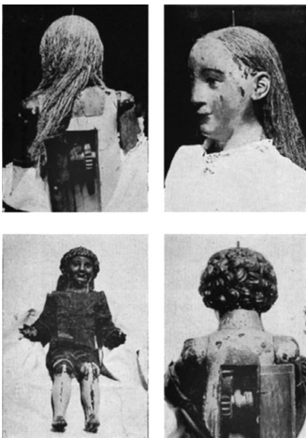
Figura 3. Maniquíes articulados de la Virgen de los Reyes y el Niño (J.Hernández Díaz).

Aunque estas imágenes de culto han pasado a ser imágenes de devoción en los tiempos modernos, alterando su composición originaria e incluso sus atuendos y coronas, además del testimonio del manuscrito antes mencionado que las presenta revestidas de ricos paños y alhajas, poseemos una hermosa cantiga alfonsí que lo corrobora: