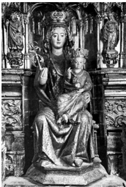
Figura 7. Virgen de la Sede, catedral de Sevilla.