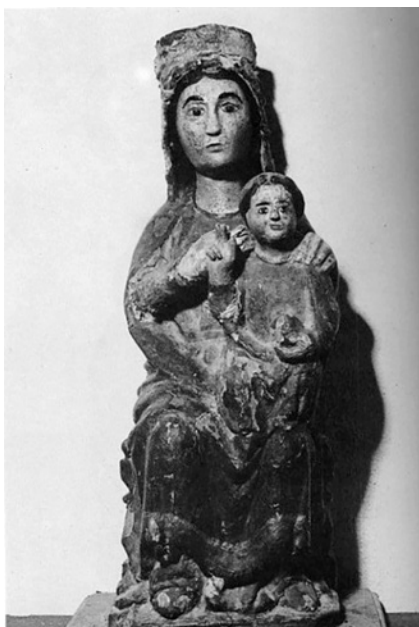
Figura 12. Virgen de la Torre, iglesia parroquial de Cumbres de San Bartolomé, Huelva (J.M. González Gómez y M.J. Carrasco Terriza).

María del Puerto, cantada por el Rey Sabio y la mutilada Virgen de Regla, que data ya del siglo XIV 119 .