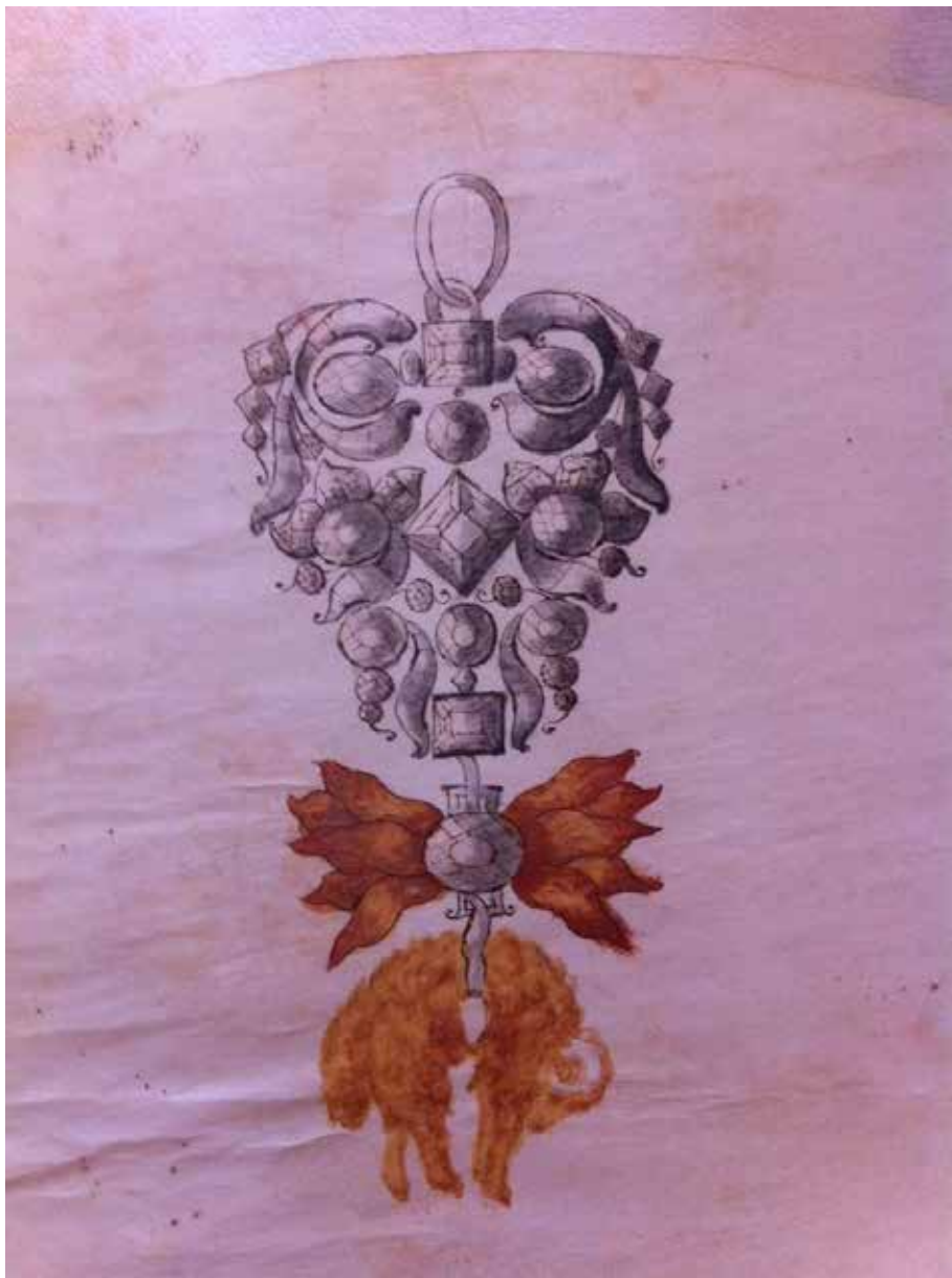
Figura 7. Josph Calbo. Dibujo del Toisón de Oro , AFCDMS, Legajo, 476, año 1750.