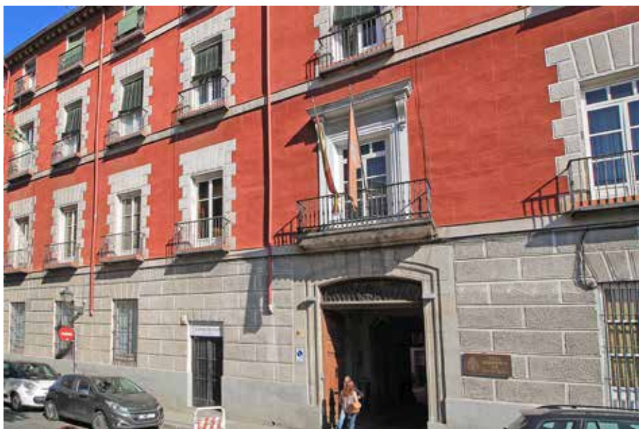
Figura 8. Palacio de los marqueses de Villafranca del Bierzo (hoy Real Academia de Ingeniería), Madrid.