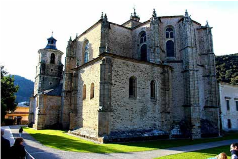
Figura 5. Vista de la colegiata de Villafranca del Bierzo.