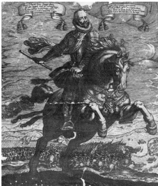
Figura 2. Gian Paolo Bianchi, Retrato ecuestre de Pedro de Toledo Osorio, V marqués de Villafranca del Bierzo , 1629, Madrid, Biblioteca Nacional de España.