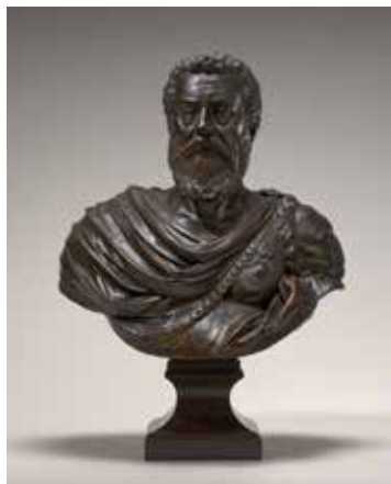
Figura 1. Anónimo, Pedro de Toledo (1484-1553) , Washington, National Gallery of Arts.